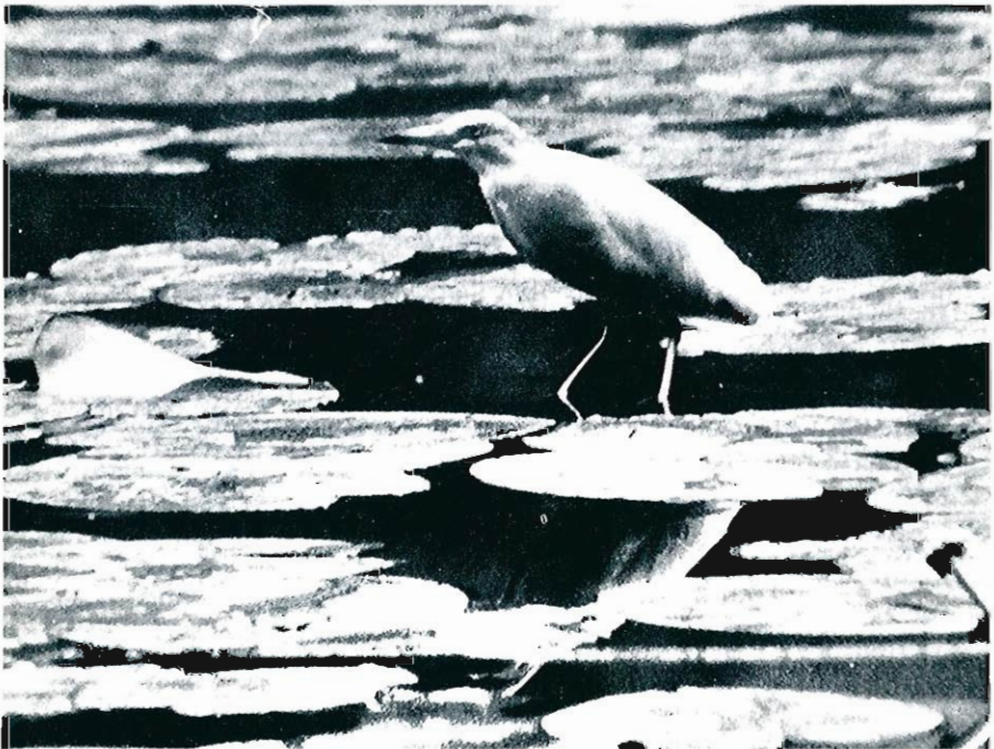
(1) Transmis à la Commission d'Homologation.

Le lendemain soir, nous le retrouvons perché sur son arbre. Avec d'autres ornithologues, nous l'observons longuement et le photographions. Il reprend sa pêche sur les nénuphars, puis, dérangé par notre présence, il s'envole vers un autre étang. Nous le redécouvrons rapidement près d'une berge à la végétation dense. Au vol, nous remarquons le cou replié en S, les pattes dépassant à peine les rectrices et les battements plus rapides que ceux du Héron cendré ( Ardea cinerea ). Inquiet, il dresse verticalement le cou, le bec horizontal. Lorsqu'il pêche en marchant, il le tend en avant. Pendant toute l'observation, il n'émit qu'un cri rauque et grave.