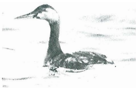
Fig.4 - Grèbe jougris : Bernissart, 18 octobre.

■ La Hulpe, 04 septembre : 2 ex. (F. De-meijere).