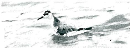
Fig.8 - Phalarope à bec large : Nieuport, 11 octobre. Le Phalarope à bec étroit ne montre jamais de telles plages gris claire sur le dos, caractéristiques du plumage pré-nuptial du Phalarope à bec large.