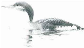
Fig.2 - Plongeon arctique : Bernissart, 29 novembre.