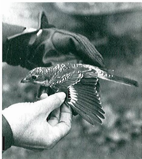
Fig.11 - Pie-grièche à tête rousse : Gosselies, du 20 septembre au 28 septembre.