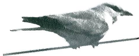
Fig.9 - Rollier d'Europe : Bastogne, 24 mai.

■ Bertogne, du 24 au 29 mai : 1 ex. (Fig. 9; M. Chable, A. Blondlet, J. Moïs, A. Collin, F. Duffey, et al. ).