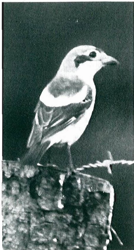
Fig.10 - Pie-grièche à tête rousse : Auderghem, 09 mai.

■ Beclers, 06 août : 1 juvénile (P. Dachy, E. Delmée, P. Simon) et non 06 juin. (Aves 19 : 110).