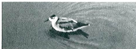
Fig.7 - Phalarope à bec large : Butgenbach, du 14 au 16 novembre.

■ Ostende, estacade et mare, du 14 au 17 novembre : 1 ex.