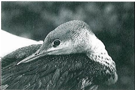
Fig.3 - Plongeon catmarin : Rhode-St-Genèse, 21 janvier.