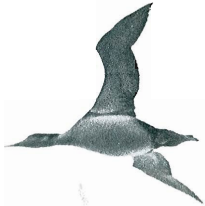
Fig.1 Plongeon imbrin : Nazareth, du 02 au 23 novembre.