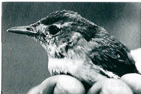
Fig.12 - Hypolaïs polyglotte : St Aubain, 03 août.

■ Dohan, les Hayons, 27 et 28 juin : 1 chanteur (S. Baugniet, S. Lhoest, D. van der Elst, J.J. Strijckmans).