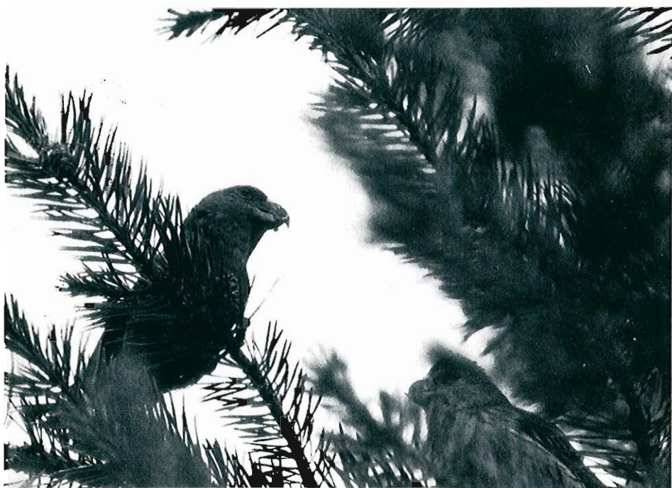
Beccroisé des sapins, juin 1974.

duelis carduelis ) : la grande majorité des données provient des provinces de Namur-Luxembourg; les petites bandes s'étoffent en août, avec au plus 30 ex. le 02.08 à Latour (PPi) et le 30.08 à Pommerœul (CRBH). TARIN DES AULNES ( Carduelis spinus ) : dans l'est de la province de Liège, des chanteurs sont localisés en juin à Elsenborn et Rocherath (Exc. Aves); apparition de jeunes à partir du 11.07 à Sourbrodt puis La Calamine (EDg); en août maximum 19 ex. le 27 à Heusy (LSc). Ailleurs, dix observations à partir du 03.07 dans les provinces de Namur et Brabant. LINOTTE MELODIEUSE ( Carduelis cannabina ) : deux observations à noter : un dortoir d'environ 4000 ex. à partir du 15.06 à Profondeville (MV) et un nid contenant 5 œufs, à terre dans un champ de pommes de terre le 03.08 à Rouveroy (AP). SIZERIN FLAMME ( Carduelis flammea ) : vol nuptial le 26.06 à Morhet (Lux.) (CGe). Les autres mentions proviennent, à l'exception d'un oiseau le 03.08 à Wavreille (MPa), de l'aire de reproduction de l'est de la province de Liège : fagnes de Malchamps et de la Baraque Michel, Elsenborn, Rocherath, Sourbrodt, Bütgenbach et Raeren; premiers jeunes volants le 11.07 (EDg, JDa, FHi, LSc,