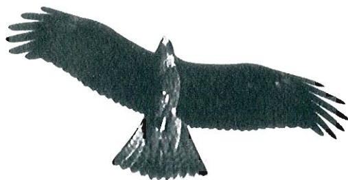
Milan noir, août 1977.