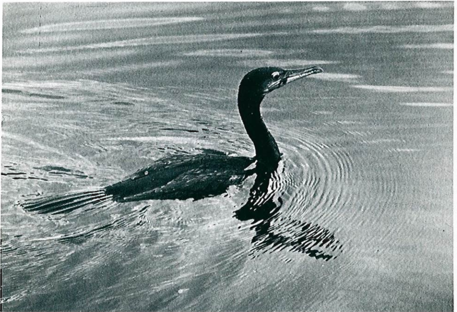
Grand Cormoran, Marais d'Harchies, 21.09.83.

GRAND CORMORAN ( Phalacrocorax carbo ) : le passage, fort important cet automne, commence dès le début septembre, avec 1 juv. les 04 et 05 à Rhode-Sainte-Agathe, 20 ex. vers le SW le 07 à Boitsfort, 32 ex. posés le 09 aux barrages de l'Eau d'Heure, tandis qu'à Harchies la présence de 1 à 8 ex. est notée jusqu'au 24 (FHe, FHa, GRa, MWa, PDI, CRBH...). Après cette date, les données deviennent plus fournies, par exemple 25 ex. en vol le 25 à La Hulpe (GRa). Un pic migratoire important est décelé début octobre, notamment le 01 avec 60 ex. à Harchies et 43 ex. à Boitsfort (LV, DVe, ML, MWa et al. ), et culmine le 09 avec 100 à 200 ex. à Rouveroy (AP), 80 ex. à Bouvignes-sur-Meuse (RL) et 45 ex. à Boitsfort, où sont observés les deux derniers vols importants de 119 ex. le 21.10 et 24 ex. le 12.11 (MWa et al. ). En novembre, de 6 à 10 ex. sont présents à Harchies jusqu'au 10; 1 oiseau blessé y reste seul par après. Des isolés fin novembre à Bütgenbach, à Oost-Maarland et aux barrages de l'Eau d'Heure (FVs, JDa, CI).