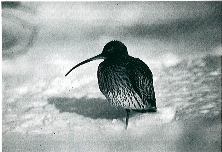
Courlis cendré Visa ABPN-BVNF.