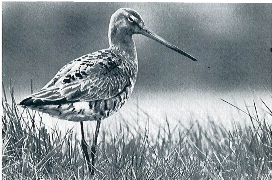
Barge à queue noire ( Limosa limosa ), Texel, printemps 1983.