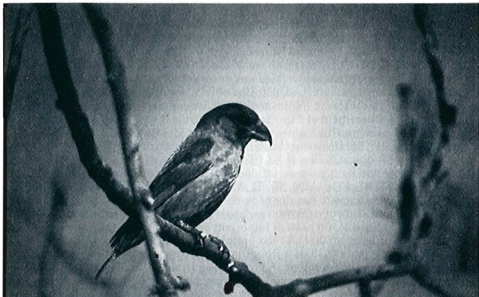
Beccroisé des sapins (Loxia curvirostra), Houffalize, mars 1984 (Photo Olivier Small-Mo).

GRAND CORBEAU ( Corvus corax )* : 6 ex. vers l'ENE le 09.03 à Libin (RLi). En avril, 1 ex. les 03 et 29 à Sommethonne (BI) et le 07 à Attert (ABI, FDI). ■ CORNEILLE MANTELEE ( Corvus corone cornix ) : une observation exceptionnellement tardive d'un ex. le 28.05 à Frasnes-lez-Couvin (PD). ■ CORBEAU FREUX ( Corvus frugilegus ) : des passages sont remarqués jusqu'au 23.03, principalement en Haute-Belgique et en Hesbaye (LSc, BDe, FDI, JMo, JDa, LG, JFi, FHi, FHe, JMDu, NPa). De nouvelles colonies s'installent à Flamierge, Buissonville, Dailly et Ohey; en outre, un couple isolé à Longchamps (Lux.) (FDf, MPa, MI, RLi, LSc). ■ CHOUCAS DES TOURS ( Corvus monedula ) : passages avec des Corbeaux freux les 18 et 23.03 à Mormont et les 20 et 21 à Aineffe (JMDu, LG). La réoccupation des nids se fait à la fin du mois; une colonie de 300 ex. sur une falaise le 17.05 à Seilles (PTe). ■ CASSENOIX MOUCHETE ( Nucifraga caryocatactes ) : observé dans la zone de reproduction classique de la haute Ardenne liégeoise : Stavelot, Lierneux, Hockai, Francorchamps et Bra-sur-Lienne (NPa, MDe, BVo, JCl, RLi, JT). En outre, plusieurs couples signalés en mai à Oignies (PDa, PS, ED); 1 ex. le 30.05 à Mormont (JMDu).