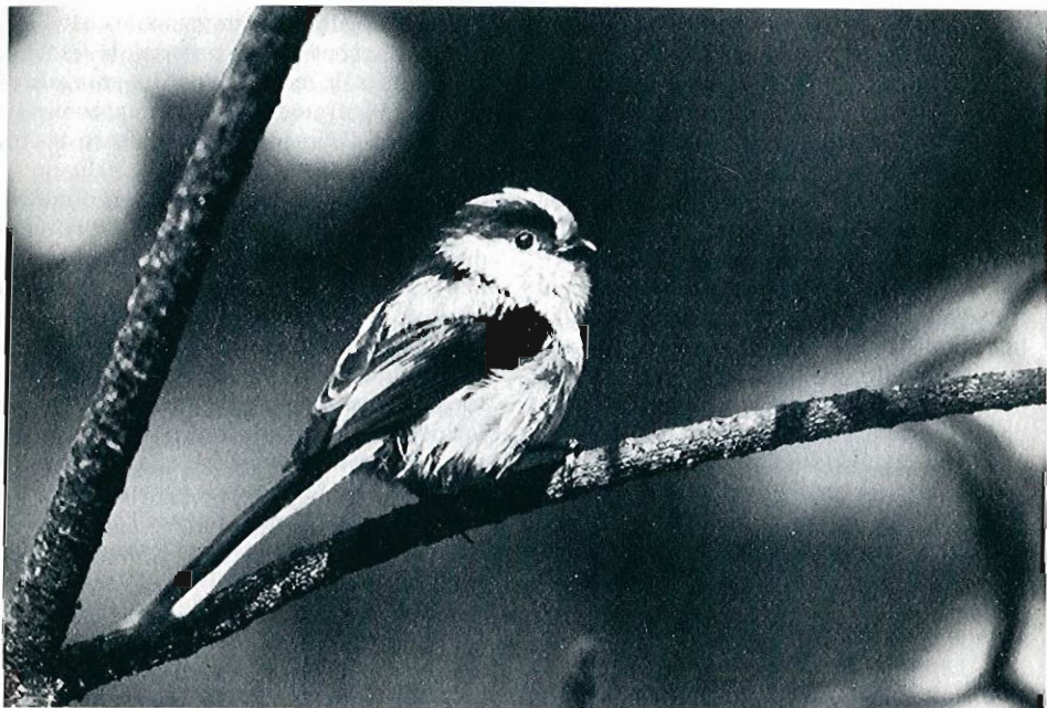
Mésange à longue queue ( Aegithalos caudatus ).

GRAND CORBEAU ( Corvus corax )* : toujours limité au Sud-Luxembourg : Herbeumont, Mabompré, Jamoigne et Pin (PPi, RDu, RL, JGa, FLu). ■ CASSENOIX MOUCHETE ( Nucifraga caryocatactes ) : plusieurs observations de l'espèce à Mormont (JMDu) et à Vielsalm le 26.08 (MDe).