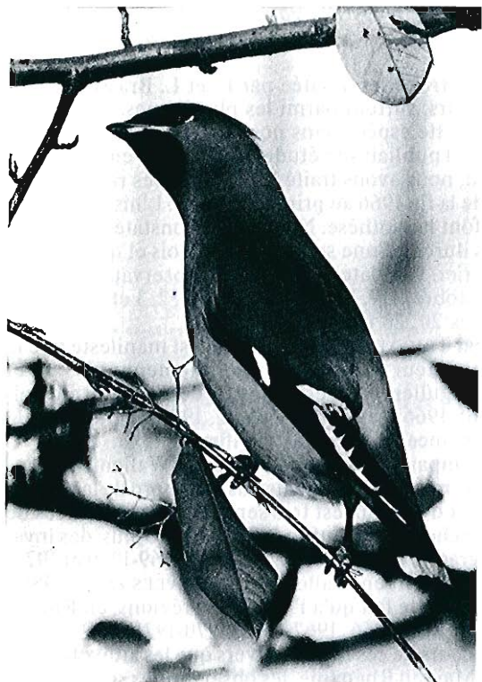
Jaseur boréal (Bombycilla garrulus), dans un Cotoneaster sallicifolia garni de baies de sorbier (voir texte); Forest, février 1986.