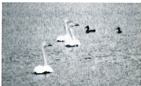
Photo 5 - Pygargue à queue blanche, Vance, 12 janvier (J. Gallez).

- Vance, 12 janvier : 1 immature (J. Gallez). (Photo 5).