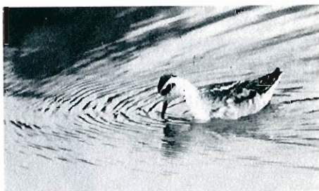
Photo 7 - Phalarope à bec étroit, Dudzele, 29 septembre.

- Dudzele, 29 septembre : 1 ex. (M. Henneghien et al. ). (Photo 7).