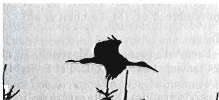
Photo 2 - Cigogne noire, environs de Bastogne, 12 et 13 août (R. de Schaetzen).

- Tintigny, Breuvanne, 11 et 12 août : 3 ex. (J. Gallez et O. Matgen).