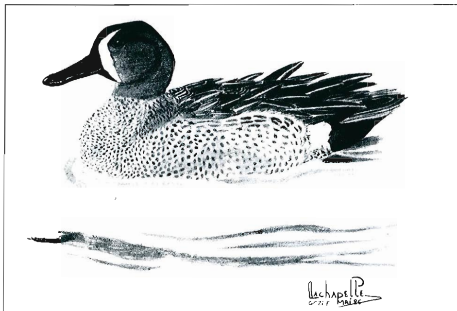
Dessin 1 - Sarcelle soucrourou , Gozée (P. Lachapelle).

l'origine sauvage ou non de cet oiseau, il faut cependant souligner que c'est l'espèce néarctique dont l'origine sauvage des oiseaux observés en Europe a été le plus souvent prouvée par le baguage (DEJONGHE, 1981; DENNIS, 1986).