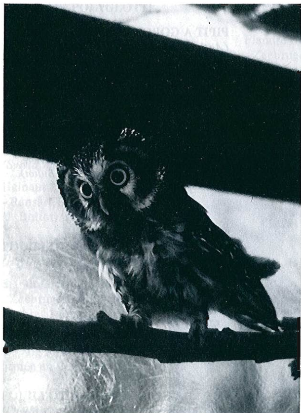
Photo 4 : Chouette de Tengmalm, Solwaster-Sart (Groupe Ornithologique Verviétois).

- Entre-Sambre-et-Meuse : 2 observations (M. Lambert).