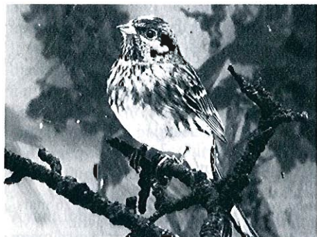
Photo 8 : Bruant à calotte blanche, Les Awirs, 9 novembre.

- Les Awirs, 09 novembre : 1 mâle capturé et bagué (R. Fraipont et al. ). (Photo 8).