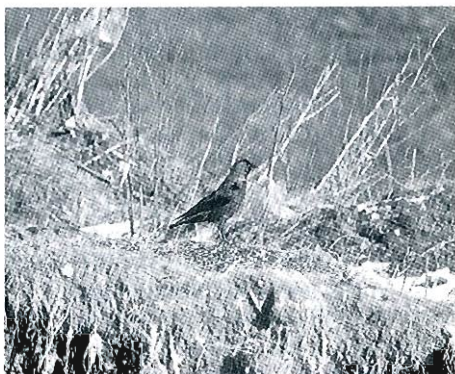
Photo 10 : Choucas des tours oriental, Henri-Chapelle, janvier.

- Henri-Chapelle, dépotoir, du 11 janvier au 07 février : régulièrement entre 2 et 5 ex. (L. Schmitz, E. Degros et al. ). (Photo 10).