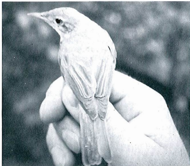
Photo 10 - Hypolais polyglotte , Herve 31 juillet.