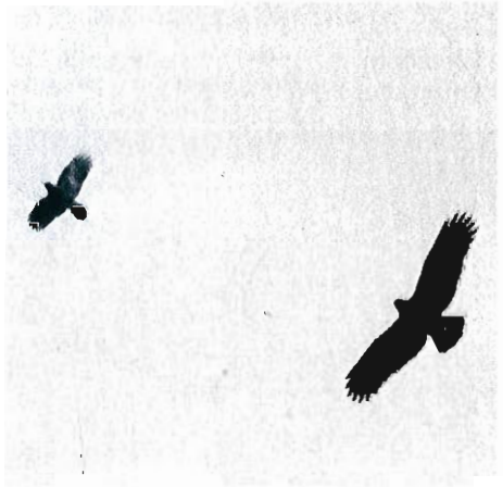
Photo 1 - Aigle criard avec une Corneille noire ( Corvus corone ), Hensies 13 novembre.

L'observation à Hensies est la onzième mention de cette espèce en Belgique, mais la deuxième cette année, un oiseau ayant séjourné près d'Anvers en février 1988. (DRIESSENS et al. , 1988).