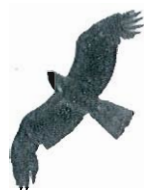
Photo 2 - Aigle botté, Hensies 10 juillet.