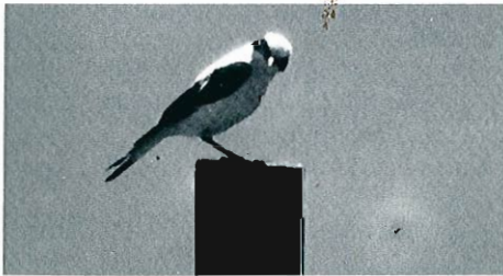
Photos 6 et 7 - Traquet oreillard ( Oenanthe hispanica ), Bastogne, Juillet 1991 (L. Verroken).

- Audenarde, 05 mai : 1 adulte (T. Debaere).