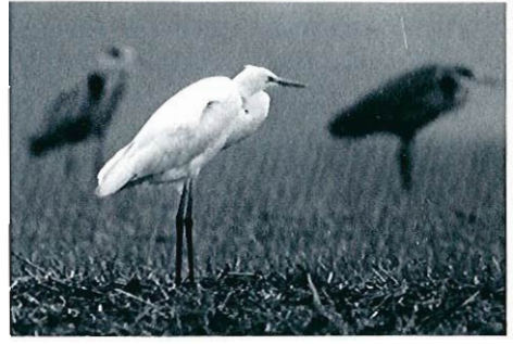
Photo 3 - Grande Aigrette ( Egretta alba ), Grand-Leez, fin 1991 (C. Poswick et P. Van Doren).