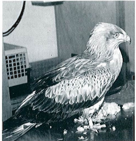
Photos 4 et 5 - Circaète Jean-le-Blanc ( Circaetus gallicus ), Noville-les-Bois , octobre 1991 (D. Vangeluwe).