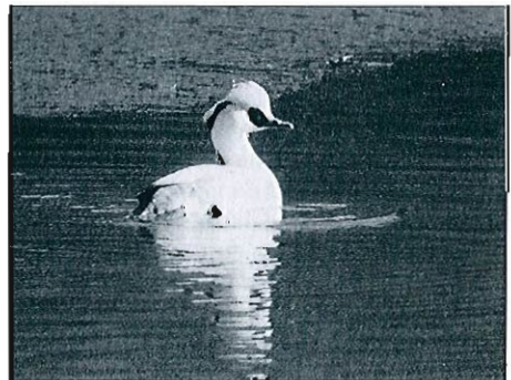
Harle piette, Tilff, 06.02.1996.