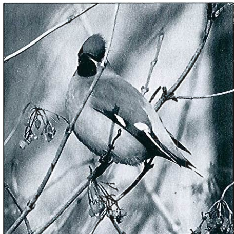
Jaseur boréal, Kraainem, 03.03.1996.

( Motacilla alba ) : assez fréquente cet hiver (par ex. 10-15 aux BEH), en particulier au Luxembourg où sa fréquence est inhabituelle en décembre-janvier (10 mentions de 1-8 ex.).