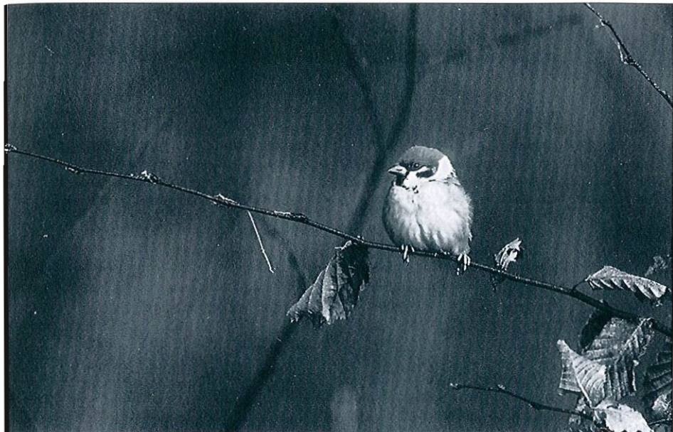
Moineau friquet (F. Renard)

en janvier à Mariembourg et de 165 à Nimy.