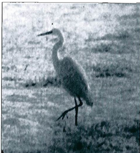
Grande Aigrette, Libois, 23.12.1995.

Grand Cormoran ( Phalacrocorax carbo ) : suite logique de l'évolution de l'espèce dans notre pays, l'expansion continue sauf en Meuse liégeoise où un tassement des effectifs est noté (légère baisse à Chertal). L'augmentation