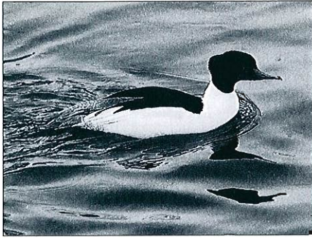
Harle bièvre, Liège, décembre 1996. (O. Schoebrechts)

merganser ) : les effectifs augmentent constamment de novembre à février. Près de 900 ex. sont totalisés fin janvier et près de 2.000 au maximum de février, dont plus de la moitié en Meuse. C'est un record absolu : même des hivers bien plus rudes chez nous n'avaient jamais vu apparaître autant de harles.