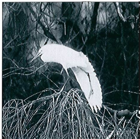
Aigrette garzette , Grand-Leez, décembre 1995.

• Cygne de Bewick ( Cygnus bewickii )* : présent à Harchies pendant toute la période avec 14 au maximum à la mi-novembre. • Cygne sauvage ( Cygnus cygnus ) : deux hivernages dont celui de Roly, spectaculaire : il y est présent dès le 12.11 et un maximum de 20 est atteint en janvier; l'autre hivernage concerne un immature à Oost-Maarland à partir du 29.12. Ailleurs, 1