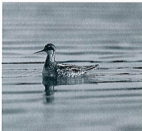
Phalarope à bec étroit, Libramont, 28 mai 1993

Le groupe de 7 adultes en 1989 est le plus important jamais observé en Wallonie. Cette donnée porte, avec l'oiseau de 1993, le total à 23 oiseaux homologués en Wallonie depuis 1975. L'espèce est principalement observée en avril.