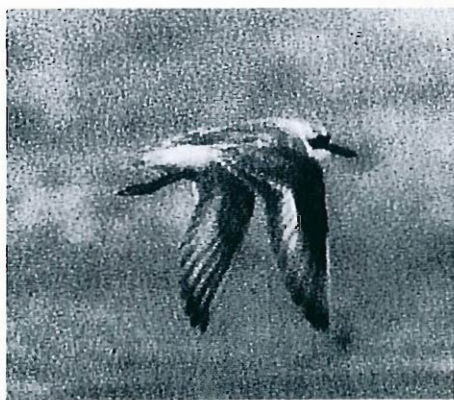
Gravelot de Leschenault, Zeebruges, 15 juillet 1993 (F. Bogaert, arch. B.A.H.C.).