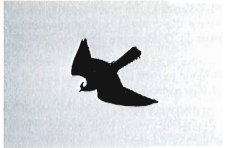
Faucon kobez, femelle, Hensies, 6 mai 1993 (L. Verroken).

août, 1 ex. en vol vers l'est (C. Vanderijdt, B.A.H.C.).