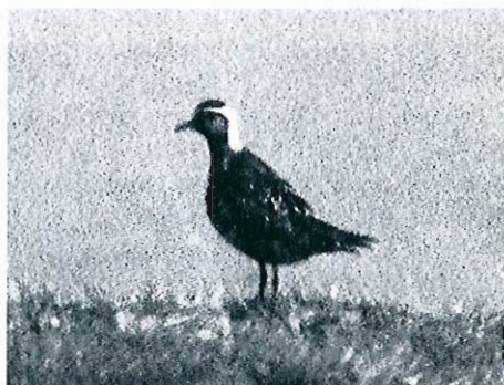
Pluvier fauve, Zeebruges, 16 septembre 1992 (N. Selosse).

Première donnée belge pour ce pluvier dont l'observation est devenue annuelle aux Pays-Bas.