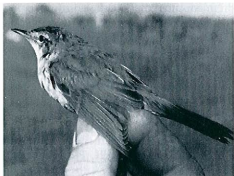
Rousserolle isabelle , Nieuwport, 4 novembre 1993 (R. Debruyne, arch. B.A.H.C.).

terrain en Belgique. La capture de novembre est particulièrement tardive et celle d'août, hâtive; celle-ci a fait l'objet d'une note par DE FRAINE (1993).