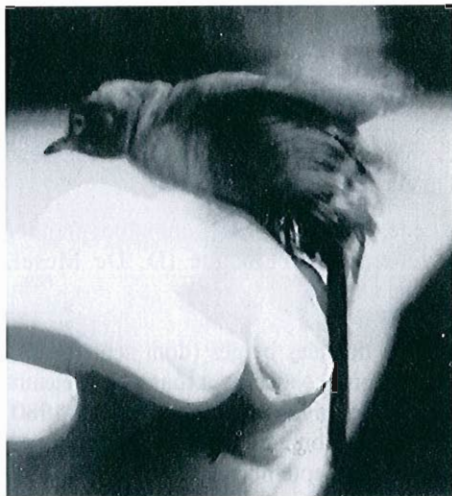
Fauvette passerinette , Retie, 1er juin 1988 (R. Debruyne, arch. B.A.H.C.).

- Le Coq (Fl. occ.), 28 avril : 1 mâle capturé et bagué (E. et P. Schepens, M.-P. Schepens-Van Thiel, B.A.H.C.).