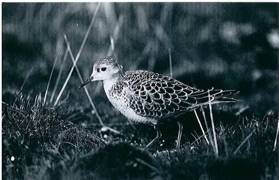
Bécasseau rousset, juvénile, Zeebruges, 9 septembre 1993 (P. Beirens, arch. B.A.H.C.).

- Escanaffles (Ht), bassins de décantation, du 26 au 29 avril : 1 adulte (L. et D. Verroken J.-L.? Lebailly et al. )