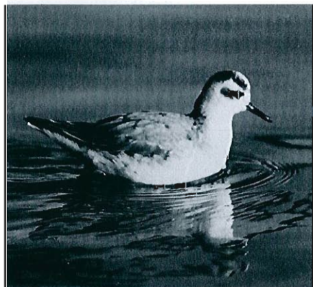
Phalarope à bec large, marais d'Harchies, 11