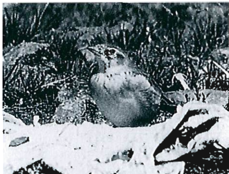
Alouette calandrella, Zeebruges, 3 août 1993 (P. Beirens, arch. B.A.H.C.).

Cette alouette est très régulièrement observée en “overshooting” au printemps en Grande-Bretagne (par ex. 15 mentions en mai 1993) mais reste très rare chez nous. L’oiseau de Zeebruges est sans doute arrivé ainsi et pourrait avoir séjourné incognito, jusqu’à sa découverte en juillet.