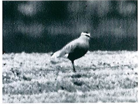
Vanneau sociable, Meise/Wolvertem, 18 avril 1993.

En Europe occidentale, ce vanneau est le plus souvent découvert en automne dans les grandes troupes de Vanneaux huppés ( Vanellus vanellus ). L'espèce semble en nette diminution sur ses lieux de nidification d'Asie centrale menacés de destruction par une agriculture agressive.