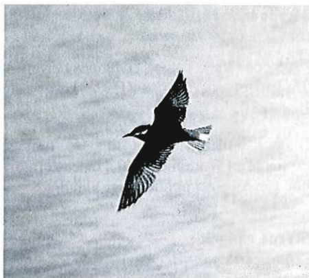
Guifette moustac, marais de Pommeroeul, 18 mai 1993 (L. Verroken).

Pas d'afflux printanier en 1993 malgré les vents d'est-sud-est. La donnée