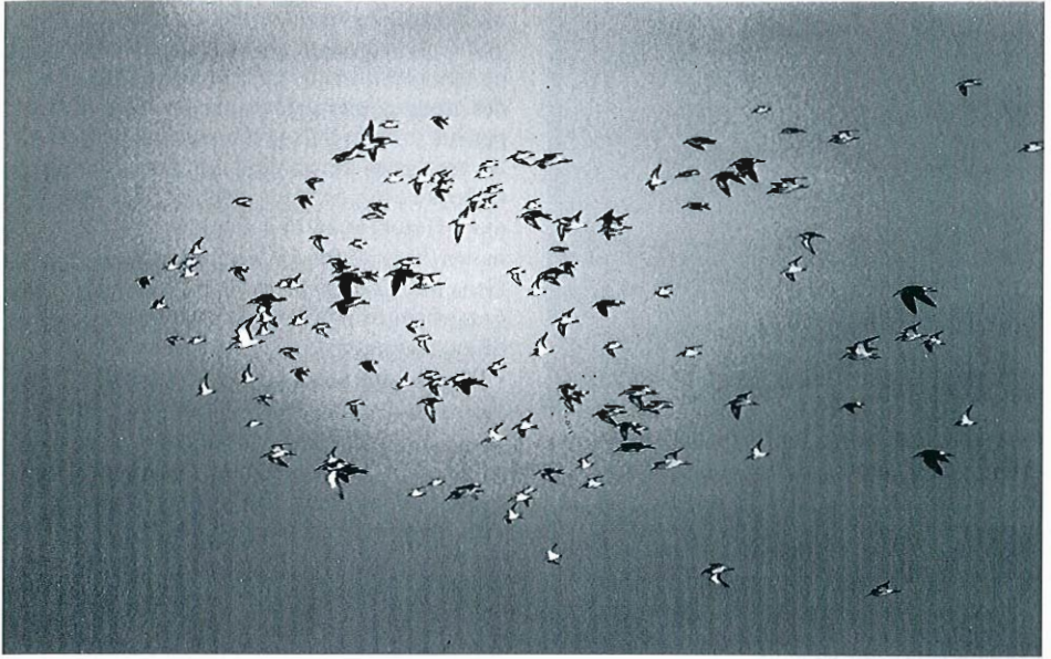
Vol de limicoles : 72 Bécasseaux minutes, 22 Cocorlis, 7 Variables et 35 Combattants. Eghezée-Longchamps, octobre 1996. (A. Joris)

centaines d'ex. en stationnement ou déplacements locaux. Des mouvements plus importants sont notés fin octobre. Quelques exemples : 1.000 ex. le 28.08 à Bergiliers; au moins 1.500 les 18.08, 31.08 et 03.09, 2.000 le 26.09 à Eghezée-Longchamps; 1.200 le 23.09 à Jamagne; 1.000 le 14.09 à Havay; 2.500-3.000 le 24.10 à Angre/Havay; 1.000 le 26.10 à Genappe; 2-3.000 le 26.10 à Houtain-le-Val; 1.000 le 27.10 à Jemelle (Gerny).