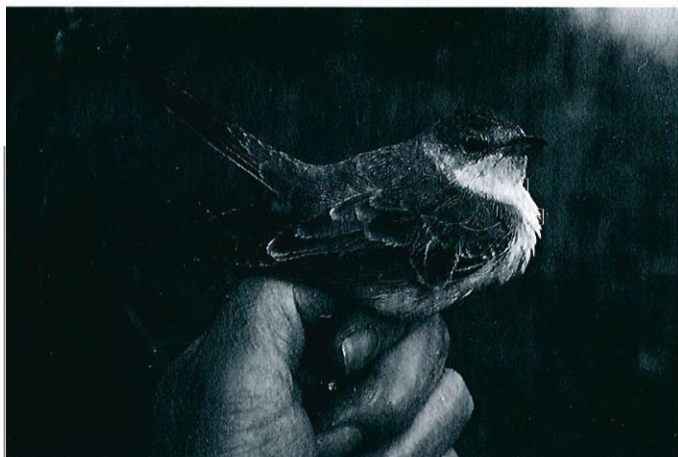
Jeune Fauvette épervière, Marche-en-Famenne, 06.09.1996.

Mésanges : le mois de septembre voit se dérouler une migration très importante de Mésanges noires, charbonnières et bleues (les autres font l'objet de quelques mentions éparses non significatives d'un phénomène particulier). Cette migration d'une importance tout à fait inhabituelle, constatée aussi chez d'autres espèces d'oiseaux forestiers, est considérée comme la conséquence d'un manque de nourriture en forêt, où les fructifications ont été très mauvaises cette année. Vu l'ampleur du phénomène, il fera l'objet d'une publication séparée, en préparation. Nous ne donnerons donc qu'un minimum d'informations dans cette chronique. Chez les trois mésanges, le phénomène a été décelé dans toutes les régions mais le plus important (ou le mieux suivi?) dans le Luxembourg, où il débute vraiment le 06.09 et se termine vers le 15.10, moment où il culmine en Brabant et en Hainaut. Les chiffres sont parfois impressionnants. • Mésange noire ( Parus ater ) : 452 ex. en moins de 2 h, dont 1 groupe de 60 le 06.09 à Sberchamps, 235 en 1/2 h le 15.09, 586 en 2 h le 13.10 à Moiricy, 1 groupe de 43 le 13.09 à Planenoit, 105 en 2 h le 15.10 à Frasnes-lez-Buissonal. • Mésange bleue ( Parus caeruleus ) : 200 ex. (avec Mésanges noires et charbonnières) le 13.09 à Wiesmes, 180-200 (avec Mésanges charbonnières) en troupes de 20-40 le 13.10 à Bossut-Gottechain. • Mésange charbonnière ( Parus major ) : 100 ex. (avec Mésanges bleues