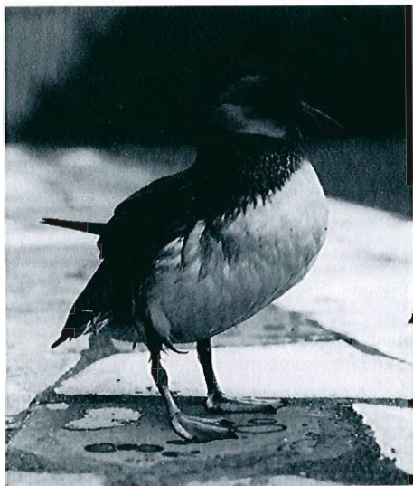
Macareux moine , Marche-en-Famenne, septembre 1996.

en petit nombre seulement : au plus 50 le 18.08 à Escanaffles et 100 le 06.10 à Visé. Deux observations en Famenne, où l'espèce est occasionnelle : 1 ex. vers le SO le 16.09 à Marche et 1 ex. le 15.10 à Sohier. • Goéland marin ( Larus marinus ) : deux données anormalement hâtives dans l'intérieur : 1 ex. le 30.08 à Frasnes-lez-Couvin et 1 juv. le 26.09 à Genappe. • Mouette tridactyle ( Rissa tridactyla ) : 1 imm. le 22.09 à Maubray et à Péronnes-lez-Antoing (le même oiseau?); plus étonnante est l'observation de 2 jeunes en migration vers le so le 24.10 à Sohier, en Famenne. • Sterne caugek ( Sterna sandvicensis ) * : 1 juv. posé le 29.08 à Warnton. • Sterne pierregarin ( Sterna hirundo ) : 1 ex. le 01.08 à Harchies. Fin août, un afflux tout à fait inhabituel à cette saison, à la suite de la tempête du 29 : ± 200 ex. (surtout des jeunes) à warnton, 70-80 à Péronnes-lez-Antoing et 6 à Ploegsteert le 29; une seulement à Péronnes et 3 à Gaurain-Ramecroix le lendemain. Hormis 1 ex. le 30 à Frasnes-lez-Couvin, ce phénomène n'a donc touché que le Tournais. Plus tard en septembre, 1 juv. le 20.09 à Achêne-Taviet. • Guifette noire ( Chlidonias niger ) : le discret