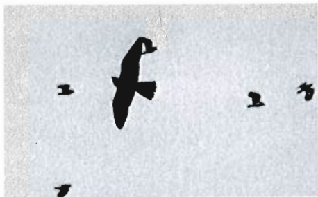
Jeune Faucon pèlerin, Eghezée-Longchamps, octobre 1996. (A. Joris)

barius ) * : une cinquantaine d'observations minimum durant la période. Le passage débute le 23.08 avec 1 ex. à St-Pierre mais se déroule principalement de début septembre à fin octobre, avec le pic de passage à la mi-octobre. • Faucon hobereau ( Falco subbuteo ) : nicheur en région bruxelloise (5 couples signalés), à Nethen et Ramillies mais, par contre, aucune nidification n'est décelée en Hautes-Fagnes cette année. Le passage se déroule classiquement de septembre à mi-octobre. Encore 1 ex. le 17.10 à Sohier, le 22.10 à Havay, le 22.10 à Harchies et le 24.10 à Bossut-Gottechain. • Faucon pèlerin ( Falco peregrinus ) : en dehors de Tihange et des Awirs, 20 sites totalisent 26 observations et 2 séjours : 1 ex. à partir du 15.10 à Houtain-le-Val et 1 ex. du 23.09 au 22.10 dans la région d'Eghezée-Longchamps. Passages dès fin août.