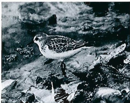
Bécasseau minute , Melsbroeck, septembre 1996.

dernier le 03.10. • Bécasseau variable ( Calidris alpina ) : passage classique en petit nombre (1-5 ex. max.) de fin juillet à mi-septembre; une augmentation sensible a lieu alors mais beaucoup moins marquée que chez le Bécasseau minute : max. 7 ex. le 26 à Hollogne-sur-Geer, 3 à Genappe et 5 à Fontenoy le 25 mais jusqu'à 15 le 25 et 14 le 30 à Eghezée-Longchamps. C'est à cette époque qu'il est aussi noté sur plusieurs sites de Haute-Belgique : Libramont (2 juv. le 11), Jemelle, Latour et Achêne-Taviet (5 ex. le 21). 1 ou 2 sont encore notés plusieurs fois en octobre, jusqu'au 18 à Genappe et jusqu'au 24 à Eghezée (encore 8 ex. le 09.10). • Combattant varié ( Philomachus pugnax ) : le passage se révèle faible en août et seulement un peu plus étoffé en septembre. Le plus souvent 1-3 ex., avec comme seules exceptions notables : 7 migrateurs le 23.08 à Angre, 5 le 19.09 et 6 les 20-21 à Genappe, 12 le 22.09 à Fontenoy et, à nouveau, le passage à Eghezée-Longchamps avec des effectifs de 15 à 41 ex. entre le 23 et le 30.09, encore 22 le 06.10 et 13 à 20 jusqu'au 24.