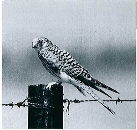
Faucon crécerelle, Grimbergen, juillet 1996. (G. Willem)

hors zone habituelle le 25.08 à Jurbise et deux migrateurs les 07 et 11.10 à Fays-les-Veneurs.