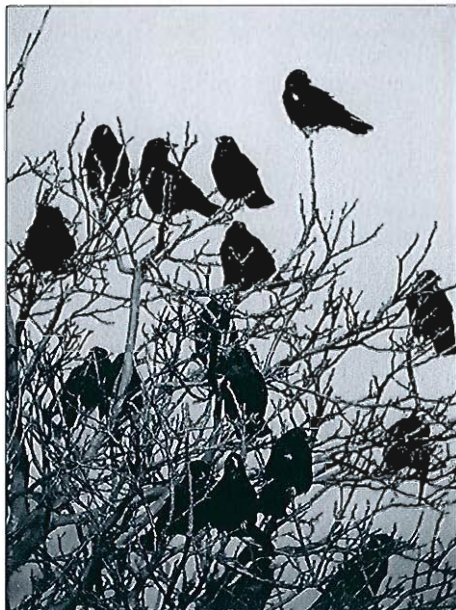
Corbeaux freux , Harzé, 22 novembre 1996. (R. Dumoulin)

Bouscarle de Cetti ( Cettia cetti ) : encore 4 postes de chant différents en décembre à Harchies. • Fauvette à tête noire ( Sylvia atricapilla ) : 3 données pour la période : 1 mâle consomme des graines de fusain le 05.11 à Mariembourg, 1 femelle le 17.11 à Engis et 1 mâle le 18.12 à Rendeux (Chéoux), candidat probable à l'hivernage. • Pouillot véloce ( Phylloscopus collybita ) : plusieurs données, sans doute de migrants attardés, dans toutes les régions jusqu'à la mi-novembre. Candidats plus sérieux au titre d'hivernants : 1 ex. le 23.11 à Molenbeek-St-Jean, le 06.12 à Ochamps, le 11.12 à Frasnes-lez-Couvin, le 15 à Waremme, le 16 à Sterpenich et Rixensart, le 22 à Mariembourg et le 28 à Oost-