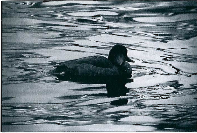
Nette rousse , Angleur 26 décembre 1996.

durant les deux mois à Harchies avec un maximum de 23 ex. le 02.11 puis 10-11 jusqu'au 13. Ensuite quelques oiseaux, avant 9 et 14 ex. les 22 et 28.12. En dehors de ce site, une seule mention : 1 ex. du 14 au 16.11 à Virelles. • Cygne sauvage ( Cygnus cygnus ) : à Roly, le premier oiseau est noté le 15.11, puis 7 ex. à partir du 21.12 et augmentation régulière pour arriver à 11 oiseaux le 28.12. • Cygne noir ( Cygnus atratus ) : (échappés) 2 ex. à la mi-novembre à Saint-Denis, 1 ex. mourant le 28.12 à Warneton. • Oie cendrée ( Anser anser ) : passage classique début novembre en Hainaut, notamment 1.200 oies en 4 heures d'observation à Flobecq le 13.11. Quelques vols tardifs totalisant encore 200 oiseaux en décembre. Sur le reste du territoire, des vols sont notés également début novembre : 70 le 08.11 à Roly, 47+46 le 13.11 à Mariembourg. • Oie rieuse ( Anser albifrons ) : 18 ex. le 14.12 à Virelles, 70 le 13.11 à Flobecq. • Oie des moissons ( Anser fabalis ) : 2 ex. le 29.12 à Neuvillers. • Bernache du Canada ( Branta canadensis ) : 15 ex. le 15.12 à Oost-Maarland, 8 ex. le 26.11 à Tilff. Reflet de la forte population flamande : 53 ex. le 13.12 à Zemst. • Bernache nonnette ( Branta leucopsis ) : 3 ex. vers le sud le 01.12 à Péronnes. Origine? • Ouette d'Égypte ( Alopochen aegyptiacus ) : minimum 10 ex. en Hainaut durant le mois de décembre, 2-3 oiseaux en Basse-Meuse et 2 ex. à Steenkerques. • Ta-