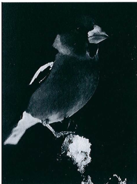
Grosbec cassenois . (Franck Renard)

ment à partir du 18.11 (100+70 ex. ce jour), souvent en mélange avec le Sizerin flammé cabaret. Ailleurs, la sous-espèce n'est en général pas précisée, sauf dans l'est de la province de Liège, où le Sizerin flammé nordique est mentionné régulièrement mais concernant presque toujours des isolés. • Beccroisé des sapins ( Loxia curvirostra ) : particulièrement rare cet automne et signalé seulement en novembre; notamment 10 ex. le 17 à Elsenborn et Sart-lez-Spa, 15 le 11 à Latour, 20 le 09 à Rendeux et 40 le 20 en Moyenne-Semois. • La rareté des mentions de Grosbec cassenois ( Coccothraustes coccothraustes ) correspond certainement bien à une réelle rareté.