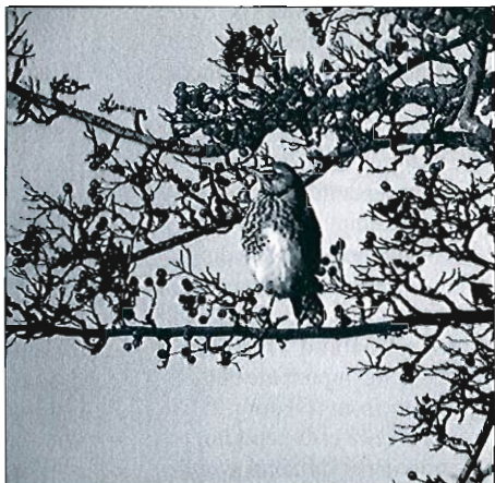
Grive litorne et Grive mauvis , Xhoris, 22 novembre 1996. (R. Dumoulin)

letta ) : la présence de l'espèce se renforce en novembre mais les nombres restent faibles en Moyenne Belgique, où le dortoir de Warchin atteint 16 ex. avant de passer à 11 ex. début décembre et se maintenir avec 3-6 ex. en fin de mois. Les autres localités du Hainaut et le Brabant (6 sites) ne donnent lieu qu'à des mentions de 1-9 ex. En Haute Belgique, la présence est plus nette. Le dortoir de Walhorn passe de 1 ex. le 01.11 à 11 le 03, 31 le 16, 31 le 07.12 et 28 le 28.12. Dans l'ESM, la cariçaie de Roly accueille un dortoir de 30-40 les 08-11.11 et l'on note plus tard 21 ex. le 25.12 à Merlemeont et 10 ex. le lendemain à Aublain. Au Luxembourg, plusieurs dortoirs : 20 ex. en novembre à Dampicourt, 15 le 12.11 à Petit-Han, 18 le 07.12 à Longvilly, 10 le 03.12 à Bertogne, mais aussi 30 du 16 au 25.12 en prairie à Jupille-sur-Ourthe. Fin décembre, le froid vide tous les dortoirs. • Bergeronnette printanière ( Motacilla flava ) : très tard, 1 ex. le 09.12 à Hampteau. • Bergeronnette des ruisseaux ( Motacilla cinerea ) : répandue en novembre-décembre, y compris en ville de Bruxelles (plusieurs hivernantes). • Bergeronnette grise ( Motacilla alba ) : l'hivernage de l'espèce au Luxembourg est à relever : présence en décembre au Gerny, à Marloie, Ciergnon, Mormont, Latour et Villers-sur-Lesse. Présente en très petit nombre en Meuse et en Moyenne Belgique après la fin de la migration, autour de la mi-novembre. A ce moment, encore des grou-