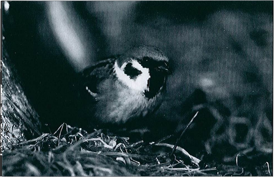
Moineau friquet. (F. Renard)

en Luxembourg et en quelques sites inhabituels du Hainaut occidental. • Grimpereau des bois ( Certhia familiaris ) : 1 ex. le 14.11 à Woluwe-Saint-Etienne*.