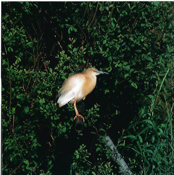
Crabier chevelu ( Ardeola ralloides), Libramont, 28.06.1997.

de nos jours (peut-être même aux Pays-Bas - SOVON, 1987). Le commerce des plumes ornementales de son plumage nuptial, diverses pertes d'habitats et les conséquences de sécheresses sahéliennes (cfr la quasi absence de données dans nos régions après les hivers de forte sécheresse) sont les principales causes avancées pour expliquer son relatif déclin.