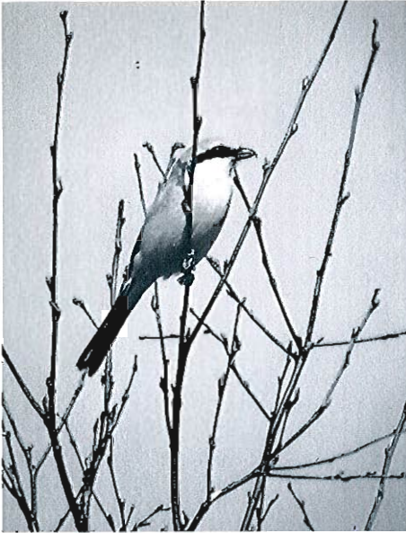
Pic-grièche grise ; Lorcé, 08.04.1997.

rio ) : premiers retours le 02.05 à Froidfontaine et au camp militaire de Marche, le 03 à Bastogne, Matagne et Fagnolle puis surtout au cours de la deuxième décennie de mai. Dans la région d'Aywaille, premier territoire occupé le 13.05 et retour d'environ 50 % de la population le 20. L'espèce continue à augmenter ses effectifs et à conquérir de nouvelles régions. • Pic-grièche grise ( Lanius excubitor ) : des hivernants encore présents fin mars à Froidchappelle et aux BEH, 1 ex. le 10.03 à Achêne-Taviet et une série classique de données çà et là en Ardenne. En Entre-Sambre-et-Meuse, 3 couples nicheurs en Fagne (BEH, Roly, Sart-en-Fagne) et 1 ou 2 à Cul-des-Sarts. • Pic-grièche à tête rousse ( Lanius senator )* : retour assez tardif du couple nicheur le 25.05 à Lamorteau.