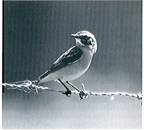
Traquet tarius; Aywaille, 03.05.1997.

Erprave et le 05 à Pommeroeul. Ensuite 3 ex. le 31.03 à Stoumont et 1 ex. le 01.04 à Dailly, eux aussi très hâtifs puisque le passage ne se développe réellement qu'à la fin avril et début mai et se prolonge jusqu'à la fin mai avec par exemple 1 ex. le 24 et 2 le 29 à Woluwe-St-Lambert, 1 le 29 à Houtain-le-Val. L'enquête menée par la COA confirme la situation critique de l'espèce : absence totale en Ardenne namuroise notamment. • Traquet pâtre ( Saxicola torquata ) : les retours très précoces, déjà nombreux en février, continuent début mars avec de nombreux sites de reproduction occupés dès ce moment dans toutes les régions. L'espèce est en outre régulièrement signalée en très nette augmentation et des installations ont lieu en plus grand nombre sur des sites habituellement peu ou pas occupés ces dernières années. La situation semble plus particulièrement favorable en Hainaut occidental et dans l'Entre-Sambre-et-Meuse. Quelques exemples : fin mars, déjà 11 cantons à Roly, 3 en plaine cultivée à Castillon / Clermont et au moins 6-7 sur 40 ha de coupes à blanc d'épicéas à Cul-des-Sarts; 70-80 couples pour la vallée de la Haine; 5 couples dans une clairière de Forêt de Soignes (Auderghem); 12 couples et 2 mâles célibataires sur 165 ha à Amay, 3 couples sur 9 ha à Lorcé, 3 en fagne de Malchamps. Premiers nourrissons le 19.04 à Flénu, généralement 3 à