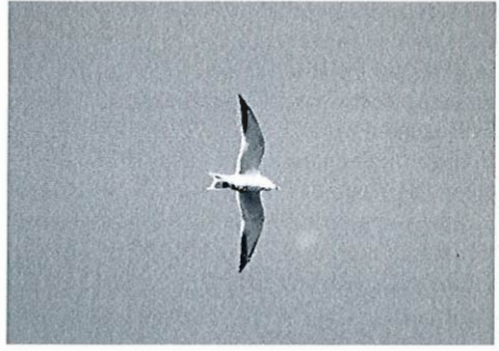
Sterne hansel; Eghezée-Longchamps, 04.05.1997.

Mouette mélanocéphale ( Larus melanocephalus )* : de plus en plus régulière : 1 ex. le 25.03 à Péronnes-lez-Antoing. • Mouette pygmée ( Larus minutus ) : passage peu développé, observé presque exclusivement en Hainaut (total de 30-40 ex.); premières (3 ex.) le 10.04 aux BEH, maxima de 8 ex. le 20 et 6 ex. le 29 à Péronnes-lez-Antoing, dernières le 02.05. • Mouette rieuse ( Larus ridibundus ) : la dernière concentration renseigne 1.000 ex. à Virelles le 05.03; la nidification est renseignée à Zemst, Genappe (6 couples), Hollogne-sur-Geer, Waremme, Eghezée-Longchamps et Fontenoy (250 nids le 11.05 mais plus que 164 le 22.05). • Goéland cendré ( Larus canus ) : la ni-