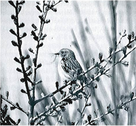
Femelle de Traquet pâtre, transport de poils pour le nid; Lorcé, 21.04.1997.