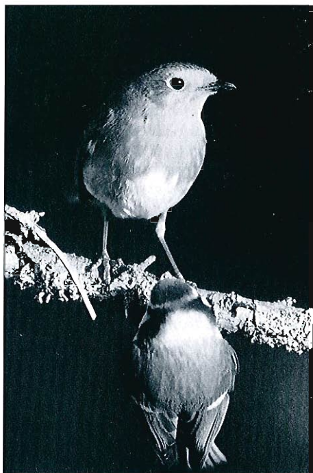
Rougegorge et Mésange bleue. Limbourg, 01.1998. (F. Renard)

Bouscarle de Cetti ( Cettia cetti ) : à Harchies, 1 à 4 ex. en décembre, 10 chanteurs en janvier et 8 en février. • Fauvette à tête noire ( Sylvia atricapilla ) : 1 mâle cherchant des insectes dans des baldingères le 11.01 à Bomal, 1 mâle le 23.01 à Jette, 1 autre à une mangeoire le 12.02 à Obourg. • Pouillot véloce ( Phylloscopus collybita ) : l'hivernage fut le plus abondant des cinq dernières années. Au nord de Bruxelles plus particulièrement, où 11 ex. sont observés en décembre pour Jette, Anderlecht, Vilvorde et Asse. Observé aussi en décembre à Hermalle-sous-Argenteau, Ampsin, Viesville et Harchies et 2 données en Ardenne, le 04.12 à