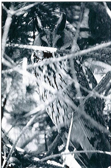
Hibou moyen-duc . Wonck, 02.1998.

signalés à Warcoing fin février. • Goéland cendré ( Larus canus ) : nombres réduits en décembre (max. 300 ex. aux dortoirs) puis forte augmentation fin janvier avec l'arrivée du froid : plus de 1.000 ex. le 31.01 aux BEH et 1.400 ex. le 01.02 à Oost-Maarland. Un adulte bagué observé le 10.01 à Maisières (Les Wartons) avait été bagué le 27.03.97 à Copenhague. Les premiers cantonnements sont signalés fin février à Harchies (1-2 couples) et à Obourg (13 adultes). • Goéland brun ( Larus fuscus ) : les effectifs hivernants sont faibles, maximum 22 ex. le 14.02 à Nimy, sauf aux BEH où on signale 26 ex. le 05.12, plus de 160 ex. le 17.01, 150 ex. le 31.01 et 35 ex. le 24.02. • Goéland argenté ( Larus argentatus ) : observé surtout aux dortoirs ou pré-dortoirs, où les nombres restent modérés : 700 ex. le 31.12 et 1.100 ex. le 13.01 à Engis, 4-500 ex. en janvier à Genval, 230 ex. le 05.02 à Obourg et 210 ex. le 05 à Nimy. Un individu leucistique est présent les 16 et 21.12 à