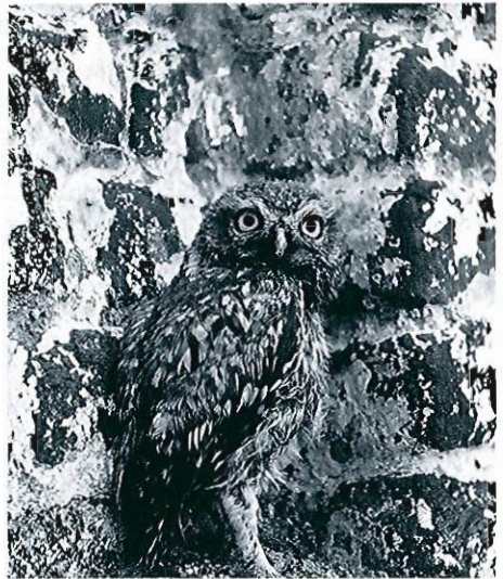
Chouette chevêche, Ambressin, 07.98.

granges peut également produire une grande nichée à l'envol comme par exemple à Pailhe où 5 jeunes sont bagués le 10.07. • Hibou grand-duc ( Bubo bubo ) : des cas de nidification sont signalés sur le plateau calcaire des environs de Philippeville, dans la vallée de l'Eau Blanche à Olloy-sur-Viroin ainsi qu'à Bastogne (1 adulte et 2 jeunes hors du nid le 26.07). • Chouette hulotte ( Strix aluco ) : l'activité diurne est signalée à deux reprises : 1 ex. chassant le 12.06 à Grand-Leez et 1 ex. chantant le 07.06 à Purnode. • Hibou moyen-duc ( Asio otus ) : taux de reproduction faible cette année avec seulement 8 nichées (sur 6 localités) en ESM et une seule nichée renseignée en province du Luxembourg à Opont ! • Chouette de Tengmalm ( Aegolius funereus ) : un chanteur entendu le 07.06 au Plateau des Tailles durant 1/2 h tandis qu'à Bourcy, deux mâles chanteurs sont présents du 01 au 10.06, un seul jusqu'au 14.07.