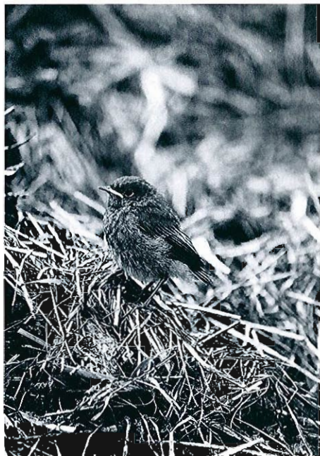
Rougequeue noir, Strainchamps, 11.07.98

Bouscarle de Cetti ( Cettia cetti ) : 2 chanteurs en juin à Harchies et 1 le 02.07 à Ploegsteert. • Locustelle tachetée ( Locustella naevia ) : 5 cantons à Malchamps, 3 à Villers-devant-Orval, nombreux chanteurs dans les coupes à blanc et jeunes plantations à la Croix-Scaille; sinon quelques mentions de chanteurs isolés comme à Hermalle-sous-Argenteau, à Ans, à Libin. Rappelons que seuls des recensements vespéraux permettent de déceler correctement l'espèce. Nourrissage tardif le 16.08 dans le camp militaire de Marche. • Phragmite des joncs ( Acrocephalus schoenobaenus ) : le passage aux Awirs débute le 31.07 et se termine le 01.09. En août, un migrateur en halte dans un champ le 05 à Angre et un chanteur le 16 à Escanaffles. • Rousserolle verderolle ( Acrocephalus palustris ) : en juin, 50 chanteurs sur 80 ha de friche à Hermalle-sous-Huy, entre 8 et 14 dans une friche à Godinne et 8 sur 2 ha à Slins.