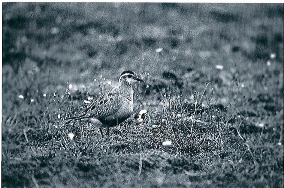
Pluvier guignard, Maasvlakte (NL), 08.98.

août, l'espèce forme des groupes de taille réduite sauf 500-700 ex. le 25.07 à Thommen, 400 ex. le 10.08 à Genappe et 625 ex. le 29.08 à Focant.