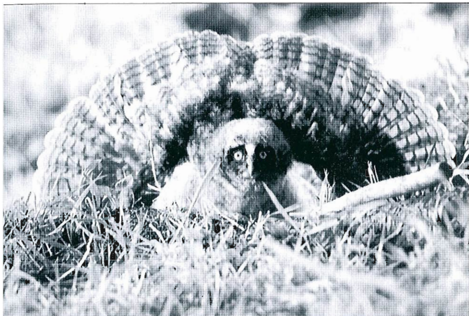
Jeune Hibou moyen-duc ( Asio otus ); Senonchamps, juin 1999 (B. Molitor)

Fontenoy, Mourcourt, Ere, Harchies et Péronnes-lez-Antoing) (sans doute par manque d'attention, en Meuse notamment). Elle est présente à Harchies tout le mois de juillet, où l'on note une nette augmentation en dernière décade. C'est également à cette période que le maximum est atteint à Gaurain-Ramecroix avec 30 ex. le 29.07. • Goéland pontique ( Larus c. cachinnans )* : un adulte estive du 28.07 au 25.09 à Pommeroeul. • Sterne pierregarin ( Sterna hirsundo ) : observée de façon sporadique sur plus d'un site : 2 ex. le 02.06 à Thommen, 3 ex. le 03.06 à Oost-Maarland, 1 ex. le 18.06 à Latour, 1 ex. le 20.06 à Sart-Dames-Avelines et à Warneton, 1 ex. le 21.06 à Pommeroeul, 2 ex. le 26.06, 1 ex. le 27.06 à Virelles, 1 ex. le 05 et 08.07 à Ploegsteert et 1 ex. 21.07 à Pommeroeul. • Sterne naine ( Sterna albifrons ) : 1 ex. le 26.06 à Harchies. • Guifette noire ( Chlidonias niger ) : dernier migrateur pré-nuptial le 09.06 à Oost-Maarland. Le passage postnuptial débute dès le 09.07 à Harchies (1 ex.), le 17.07 à Nimy et le 18.07 à Escanaffles; il se poursuit jusqu'à fin août, notamment à Harchies. • Guifette leu-