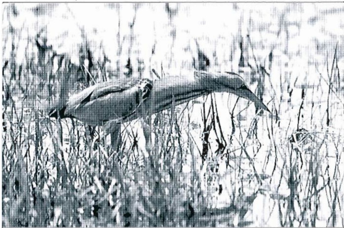
Blongios nain ( Ixobrychus minutus ). (A. C. Zwaga)

cheurs (3 en juin et 5 supplémentaires confirmés en juillet); des juvéniles isolés sont observés à partir du 21.07. 1 chanteur le 09.06 à l'étang de Boneffe. • Héron bihoreau ( Nycticorax nycticorax )* : 1 vol de 4 adultes et 3 immatures le 10.06 à Wierde et 1 ex. les 14 et 15.06 à Ruette.