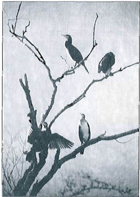
Grands Cormorans au dortoir de Chanxhe, janvier 2000

wickii ) : uniquement à Harchies : 9 ex. présents depuis le 01.11 séjournent jusqu'au 25.12, 11 ex. le 05.12, 14 ex. le 06.12; ensuite diminution avec 6 ex. le 27.12, 2 ex. le 29.12 puis remontée à 8 ex. jusqu'au 25.02. 4 ex. les 26 et 27.02 (dernière date d'observation). • Cygne chanteur ( Cygnus cygnus ) : à Roly, 5 ex. jusqu'au 11.12 puis augmentation progressive pour arriver à maximum 19 ex. en février. Ailleurs, 1 ex. le 15.01 à Ciergnon. • Oie des moissons ( Anser fabalis ) : 7 ex. vers le SE le 22.12 à Martouzin-Neuville, 1 ex. vers le N le 26.12 à Herseaux, 2 ex. du 21 au 31.01 à Warneton, 1.850-1.900 ex. en 15' vers l'O le 26.12 et 4 ex. posés le 13.02 à Oost-Maarland, 33 ex. le 05.01 à Torgny et 71 ex. vers le NE le 30.01 à Gaurain-Ramecroix. • Oie rieuse ( Anser albifrons ) : 54 ex. en vol le 26.12, 3 ex. le 16.01, 5 ex. le 06.02 et 8 ex. le 26.02 à Oost-Maarland; 12 ex. le 02.01 à Castillon. • Oie cendrée ( Anser anser ) : dernière vague de passage avec un total de 121 ex. du 05.12 au 30.12 en Hainaut occidental. A Oost-