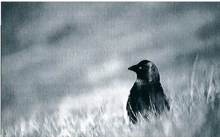
Choucas des tours, juillet 2001 (A. Joris)

Pinson des arbres ( Fringilla coelebs ) : hivernage relativement peu abondant, peu de grosses concentrations : 50 à 100 ex. le 12.12 à Genappe, 150 ex. le 09.01 à Noville et 80 ex. le même jour à Pommeroel. Premiers chants le 02.02 à Loncée et au Sart-Tilman. Les premiers migrateurs sont repérés le 13.02 à Pommeroel avec 7 ex. vers le N et retour massif le 26.02 à Malmedy. • Pinson du Nord ( Fringilla montifringilla ) : hivernage peu abondant avec 4 données de plus de 10 oiseaux : 100 ex. le 15.12 à Ombret-Rawsa, 35 ex. le 19.12 à La Gileppe, 50 ex. le 15.01 à Tournai et 17 ex. le 02.02 à Ploegsteert. Remontée massive de migrateurs le 28.02 à Spa. • Serin cini ( Serinus serinus ) : 1 ex. en vol le 05.12 à Harchies; premiers retours dès le 23.02 avec 2 ex. à Ploegsteert. • Verdier d'Europe ( Carduelis chloris ) : dortoir de 86 ex. le 01.01 à Strombeek-Bever, 70 ex. le 06.12 à