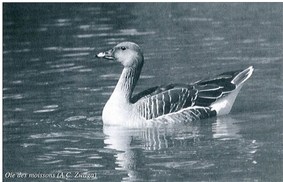
Oie des moissons (A.C. Zwaga)

vingtaine d'hivernants et des maxima ponctuels de 48 ex. le 18.12, 99 ex. le 29.12, 36 ex. le 03.01, 35 ex. le 15.01. Autres sites importants avec leurs maxima : Oost-Maarland (50 ex. le 26.12), Ploegsteert (51 ex. fin février), Warneton (27 ex. en janvier) et les BEH (25 ex. le 09.01). Ailleurs, toujours moins de 10 ex. • Sarcelle d'hiver ( Anas crecca ) : les effectifs sont assez élevés dès la mi-décembre avec des maxima locaux de 360 ex. le 26.12 à Waremme et 160 ex. le 13.12 aux Marionville. Sur les autres sites majeurs d'hivernage que constituent Latour et Harchies, les effectifs sont les plus importants début février avec 97 ex. le 10 pour le premier et 150 ex. le 06 pour le second. D'autres sites accueillent l'espèce durant tout l'hiver mais il n'y a jamais plus de 100 oiseaux excepté à Virelles où l'on en dénombre 164 ex. le 23.01. • Canard colvert ( Anas platyrhynchos ) : l'hivernage culmine durant les deux dernières décades de décembre avec notamment 800 ex. le 12 à Waremme, 623 ex. le 19 à Gaurain-Ramecroix, 517 ex. le 30 à Latour, 330 ex. le 26 à Virelles et 326 ex. le 19 à Genappe. • Canard pilet ( Anas acuta ) : quelques données mais jamais de plus de 3 ex. aux BEH, à La Gileppe, à Latour, Hollogne-sur-Geer, Genappe, Harchies, aux Ma-