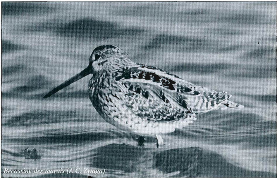
Bécassine des marais (A.C. Zwaga)

Bécasseau variable ( Calidris alpina ) : seulement deux mentions : 1 ex. le 25.02 à Gaurain-Ramecroix et Warneton. • Combattant varié ( Philomachus pugnax ) : quelques mentions (22 ex. au total dont 7 à Renaumont) de migrants pré-nuptiaux dès le 25.02. • Bécassine sourde ( Lymnocyptes minimus ) : une quinzaine d'ex. de cette espèce discrète sont signalés du 20.12 au 13.02, surtout en province du Luxembourg. • Bécassine des marais ( Gallinago gallinago ) : l'hivernage est décelé surtout en province du Luxembourg (maxima : 47 ex. le 19.12 à Libramont, 46 ex. les 29.12 et 02.01 à Boeur, 46 ex. le 05.01 à Dampicourt) et en Hainaut occidental (maxima : 97 ex. le 22.01 aux Prés d'Amour de Warchin, 94 ex. le 25.02 au Pont Cocu (Pommeroel). • Bécasse des bois ( Scolopax rusticola ) : espèce très discrète en hiver et peu renseignée : 25 ex. au total de la période, dont 8 levés à Angre le 11.12. • Barge à queue noire ( Limosa limosa ) : la migration débute le 25.02 avec 19 ex. à Roisin; au total, il y passera 107 oiseaux du 25.02 au 14.03 : record régional. • Courlis cendré ( Numenius arquata ) : deux observations sur l'hiver : 13 ex. à Oost-Maarland le 02.01 et 1 ex. en vol le 26.02