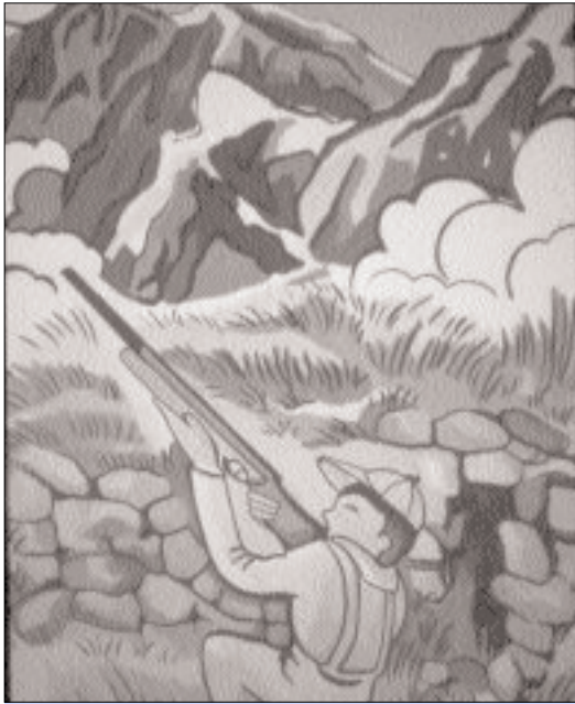
Photo 2 - Extrait du module Houtopia : la chasse dans les Pyrénées. - One of the pictures of the "Children City" Houtopia exposition : hunting in the Pyrenees.