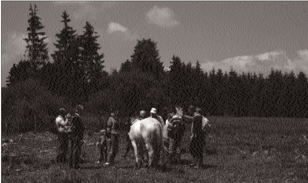
Photo 1 - Visite guidée dans une réserve gérée grâce à l'aide de chevaux de la race Fjord. - Visit in a nature reserve grazed by Fjord horses.