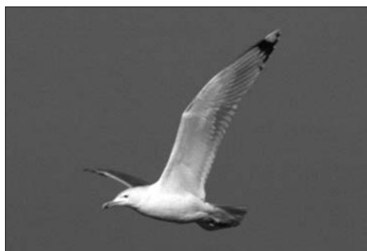
Photo 3 - Goéland pontique ( Larus cachinnans ), Visé (Lg), 11 février 2000. L. Raty