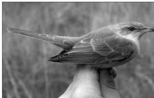
Photo 5 - Fauvette épervière ( Sylvia nisoria ), Les Awirs, 22 août 2003. S. Leunen