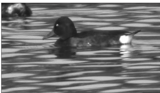
Photo 1 - Fuligule nyroca ( Aythya nyroca ), Eghezée-Longchamps, 9 août 2003. M. Ameels

- 9 août 2003, Eghezée (N), Longchamps, bassins de décantation : 1 mâle ad. (Ameels M.; CH; photo Ameels M. arch. CH).