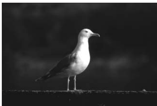
Photo 2 - Goéland pontique ( Larus cachinnans ), Ile Monsin (Lg), 11 février 2000. L. Raty