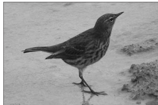
Photos 4 - Pipit maritime ( Anthus petrosus ), Warneton, 23 avril 2003. Th. Tancrez