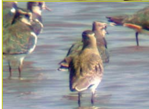
Photo 1 et 2 Vanneau sociable / Sociable Lapwing – Éghezée-Longchamps – 22.09.05