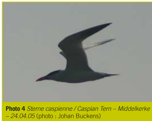
Photo 4 Sterne caspienne / Caspian Tern – Middelkerke – 24.04.05

- 25 août 2005, Beveren (O), Verrebroek, Verrebroekse Plassen : 1 juv. (Deduytsche B.; BAHC; photo arch. BAHC).