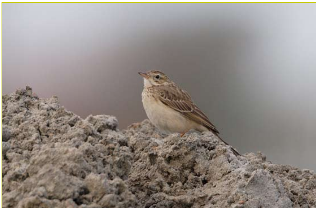
Photo 5 Pipit de Godlewski / Blyth's Pipit – Oostende – 19.11.05 (photo : Patrick Beirens)

- 26 octobre 2004 , Dendermonde (O), Grembergen : 1 imm. de 1er hiver, capturé et bagué (Mannaert J.; BAHC; photo arch. BAHC).