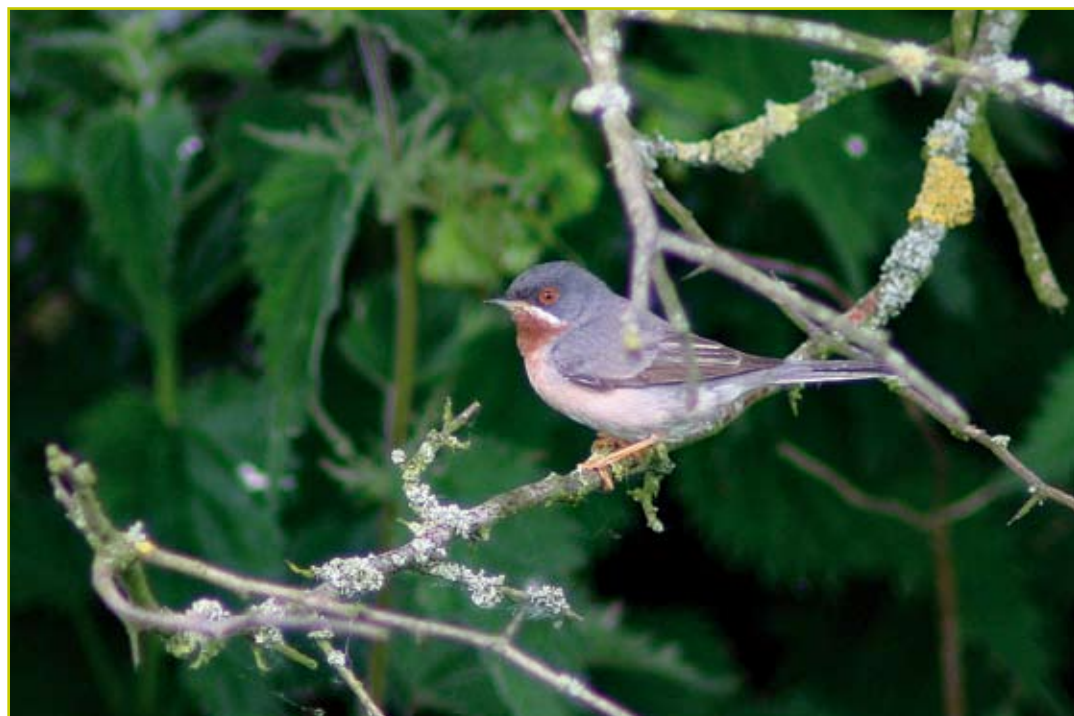
Photo 6 Fauvette passerinette / Subalpine Warbler – Kieldrecht – 25.05.05

- 17 au 27 avril 2005, Poperinge (W), Helleketelbos : 1 mâle chanteur (Dochy O.; BAHC; rapport