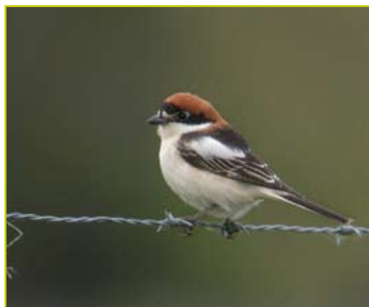
Photo 7 Pie-grièche à tête rousse / Woodchat Shrike – Raversijde – 01.05.05

- 6 au 11 juillet 2005, Knokke-Heist (W), Knokke :