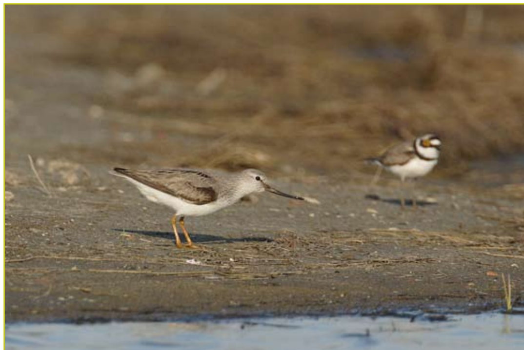
Photo 3 Chevalier bargette / Terek Sandpiper – Kieldrecht – 25.05.05

- 28 mars 2005, Gent (O), Bourgoyen : 1 ad. (Spanoghe G.; BAHC).