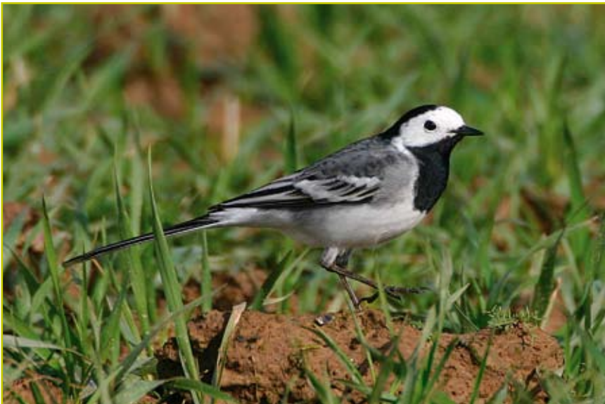
Photo 4 Hybride Bergeronnette grise x Bergeronnette de Yarrell / Pied x White Wagtails Hybrid – Juprelle – 08.03.07

Rossignol philomèle ( Luscinia megarhynchos ) : premier chanteur le 09.04 à Mariembourg. Les oiseaux suivants sont notés le 15.04, date à laquelle l'espèce devient plus régulière. On note déjà 5 chanteurs le 20.04 à Rochefort et 15 chanteurs le 25.04 au camp militaire de Marche-en-Famenne. Bien renseigné en mai dans le sud de l'Entre-Sambre-et-Meuse, avec notamment 20 chanteurs autour de Mariembourg. Gorgebleue à miroir ( Luscinia svecica ) : la première est entendue le 12.03 à Ploegsteert où au moins 7 chanteurs sont présents le 12.04. L'espèce est surtout présente dans le Hainaut où elle se reproduit aussi dans les cultures entrecoupées de petits fossés. Elle se cantonne aussi dans les décanteurs d'Éghezée-Longchamps et de Hollogne-sur-Geer (chaque fois 2 chanteurs). Pour la deuxième année consécutive, le site de la gravière d'Amay accueille trois couples. Rougequeue noir ( Phoenicurus ochrurus ) : les premiers retours sont notés le 12.03 à Froidchapelle, le 17.03 à Frasnes-lez-Buisenal et Ocquier, précédant une arrivée massive entre le 20 et le 25 mars. La migration se prolonge apparemment jusqu'à la mi-avril (une femelle baguée le 18 aux Awirs). Rougequeue à front blanc ( Phoenicurus phoenicurus ) : premier dès le 02.04 à Virelles. À partir de cette date, les données deviennent régulières et un nombre important de nicheurs sont présents fin