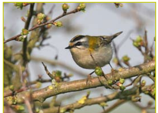
Photo 8 Roitelet triple-bandeau / Firecrest – Harzé – avril / April 2007.

Pie bavarde ( Pica pica ) : l'ex. leucique de Limal est encore présent le 18.03; un autre est signalé le même jour à Hauset (Eynatten). Cassenois moucheté ( Nucifraga caryocatactes ) : peu de données. Parmi elles, 1 ex. le 10.05 à Vierves-sur-Viroin. Corneille noire ( Cor-