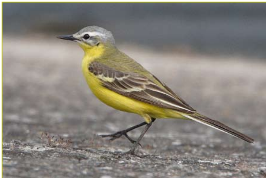
Photo 5 Hybride Bergeronnette printanière x Berge- ronnette flavéole / Yellow x Yellow-hea- ded Wagtail hybrid – Pommeroeul – Mai / May 2007