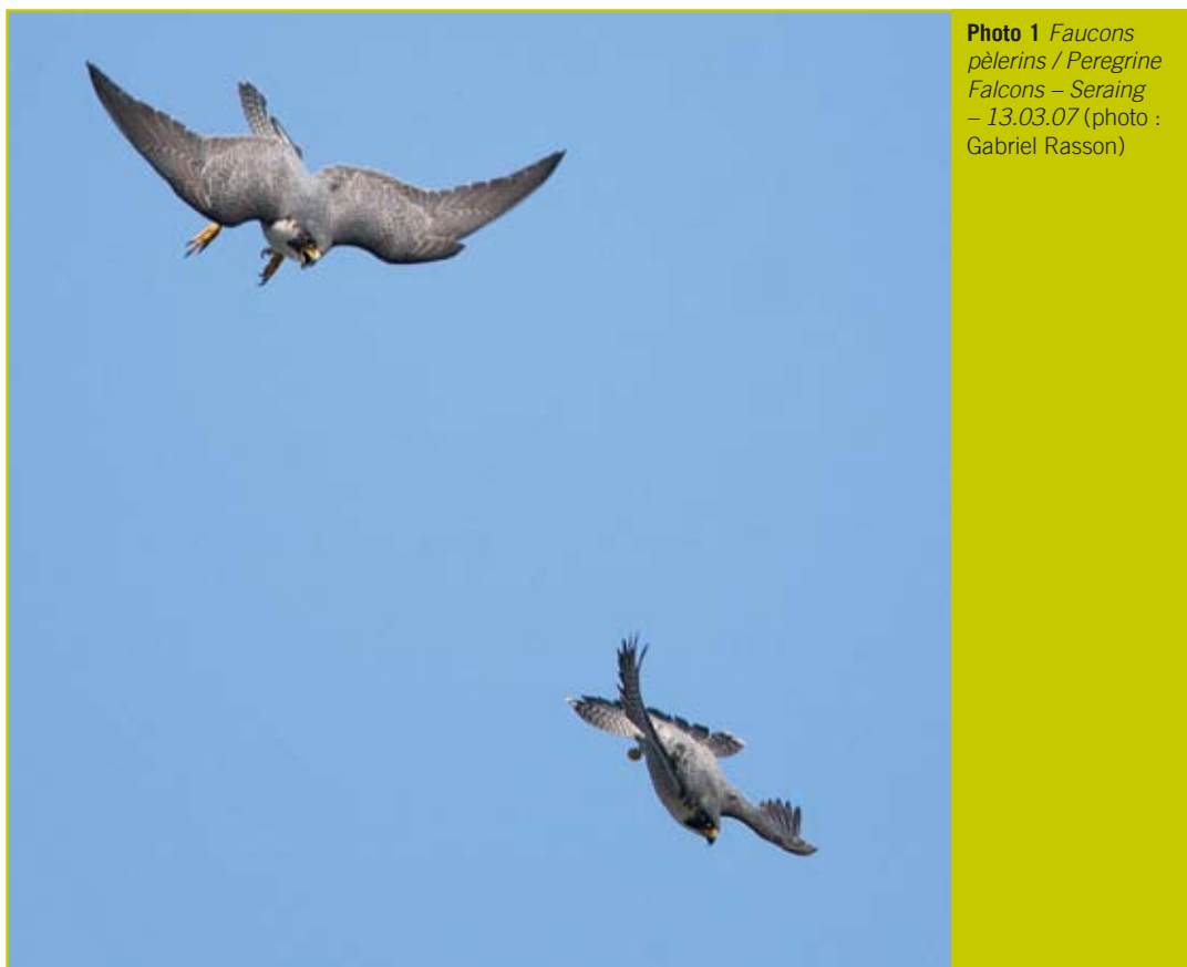
Photo 1 Faucons pèlerins / Peregrine Falcons – Seraing – 13.03.07

Bécasseau maubèche ( Calidris canutus ) : les conditions météorologiques favorables ont permis l'observation de groupes importants en Flandre le 09.05 (154 ex. au Mechels Broek, 52 ex. à Tirlemont) et de nombres