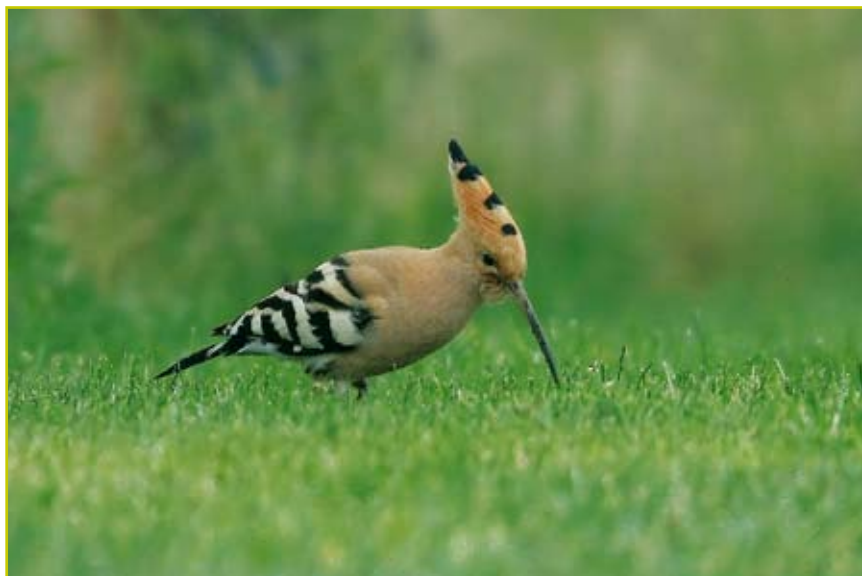
Photo 3 Huppe fasciée / Hoopoe – Fléron – 23.04.07

Pipit rousseline ( Anthus campestris ) : en avril, 1 ex. le 16 à Hollogne-sur-Geer, le 19 à Boneffe et à Mesnil-Saint-Blaise. Pipit des arbres ( Anthus trivialis ) : les premiers retours ont lieu le 05.04 à Vielsalm, Mazée et Treignes. L'espèce est assez bien renseignée en avril-mai; les premiers nourrissages sont mentionnés le 27.05 à Remience (Vaux-sur-Sûre). Pipit farlouse ( Anthus pratensis ) : parades et chants se poursuivent au cours de mars et avril; quelques mentions de nourrissage en mai. Les migrateurs nordiques traversent la région au cours du mois d'avril, avec un pic du 6 au 15 : 68 ex. en 2h le 6 à Havinnes, 17 en migration active et 23 en halte le 9 à Arc-Ainières, passage continu par petits groupes le 12 à Bailièvre, migration presque continue le 14 à Erbisoeul et le 15 à Horrues, nombreux en halte migratoire le 15 dans le val de l'Espierres... Pipit spioncelle ( Anthus spinoletta ) : les observations se poursuivent en mars avec de nombreux