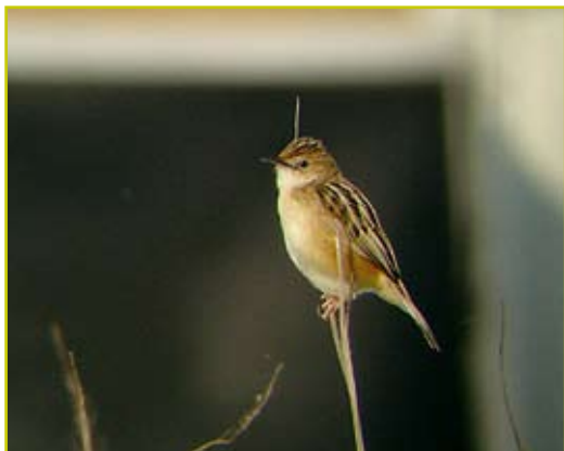
Photo 7 Cisticole des joncs / Zitting Cisticola – Mouscron – 24.05.07.