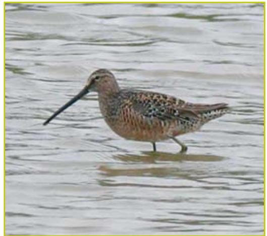
Photo 2 Bécassin à long bec / Long-billed Dowitcher – Mont-Saint-Guibert – 13.05.07

Bécassine sourde ( Lymnocyptes minimus ) : 7 données pour 11 ex. en mars et 5 données pour 6 ex. en avril, c'est peu. Retenons 3 ex. le 23.03 à Amay, 2 ex. le 22.03 à Stockay-Saint-Georges et 2 ex. le 25.03 à Bambois. Une dernière est levée le 18.04 à Sclaigneaux. Bécassine des marais ( Gallinago gallinago ) : février et ses températures relativement douces ayant autorisé la remontée de nombreux oiseaux, des bécassines sont signalées très régulièrement en mars et jusqu'en seconde décennie d'avril, mais les rassemblements dépassant la vingtaine d'ex. sont l'exception (maxima : 34 ex. le 09 et 31 ex. le 28.03 à Latour, 29