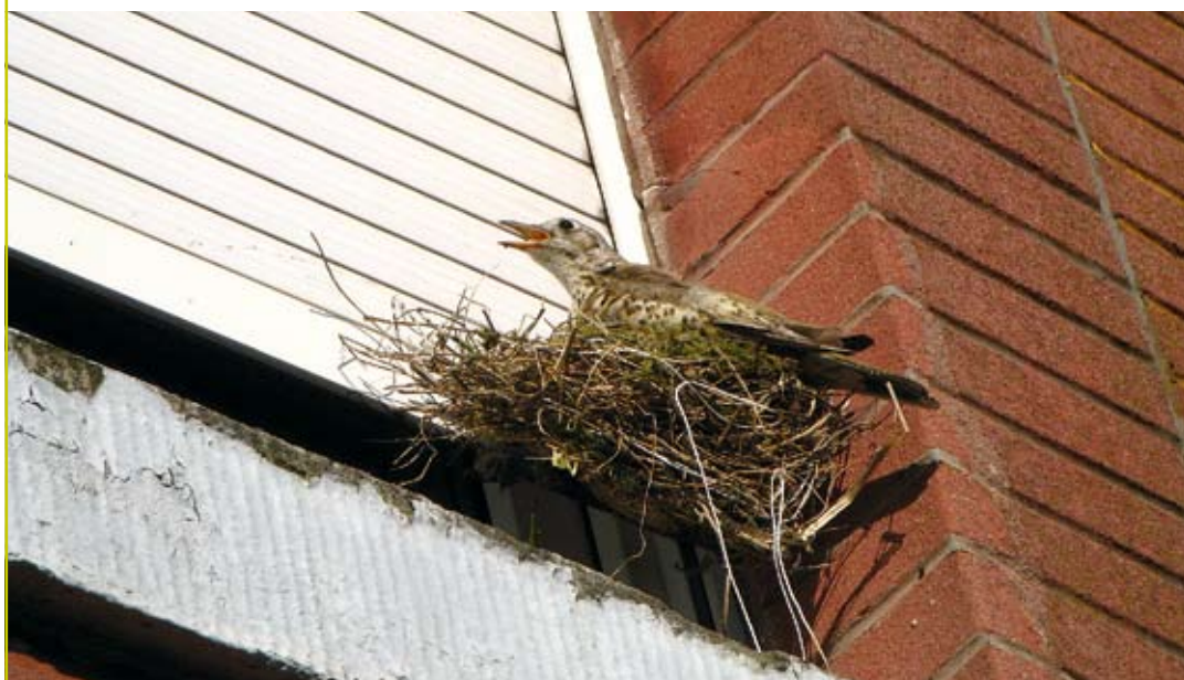
Photo 6 Grive draine / Mistle Thrush – Montegnée – 19.04.2007