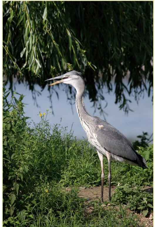
Héron cendré, Visé, 13 juin 2007 / Grey Heron, Visé, 13 June 2007

Héron cendré ( Ardea cinerea ) : la colonie d'Hensies a atteint 151 nids. Celle de Rosières comptait 29 nids. Notons certaines concentrations postnuptiales : 16 ex.