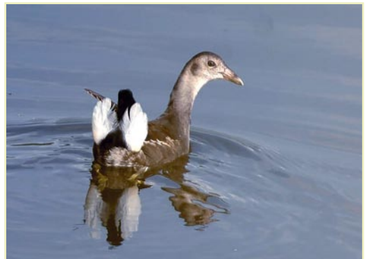
Poule d'eau juvénile, Hologne-sur-Geer, 7 août 2007 / Juvenile Moorhen, 7 August 2007