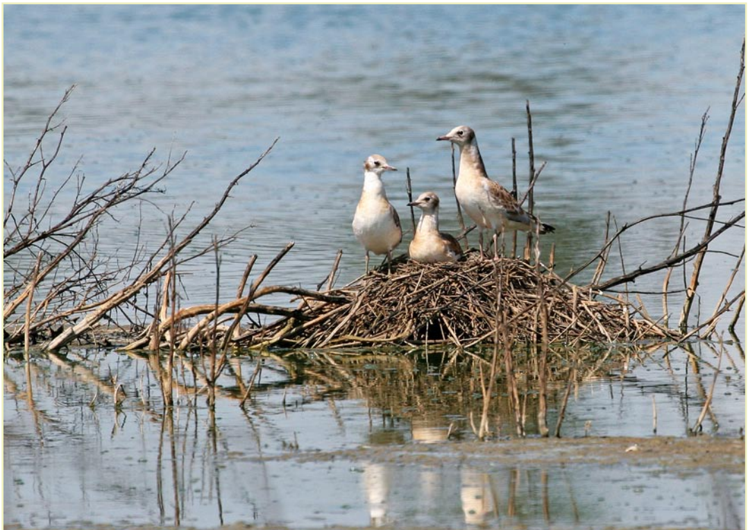
Mouette rieuse, Longchamps, 17 juin 2007 / Black-headed Gull, Longchamps, 17 June 2007

Sterne pierregarin ( Sterna hirundo ) : fin du passage en juin : 1 ex. le 10 Sombreffe et à Namèche, 3 adultes