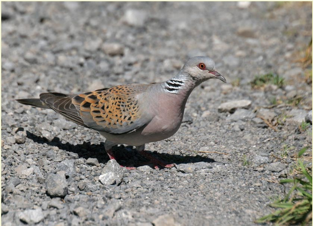
Tourterelle des bois, Harzé, août 2007 / Turtle Dove, Harzé, August 2007

Chouette de Tengmalm ( Aegolius funereus ) : encore 2 chanteurs le 10.06 à la Croix-Scaille (Gedinne). Hibou grand-duc ( Bubo bubo ) : observation peu banale d'un ex. dévorant un Autour à Nassogne le 02.06. Hors vallée de la Meuse et régions voisines, notez une nouvelle reproduction réussie dans le Tournaisis (3 jeunes à l'envol). Hibou des marais ( Asio flammeus ) : en août,