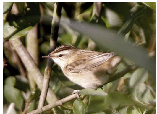
Phragmite des joncs, Hologne-sur-Geer, 3 août 2007 / Sedge Warbler, 3 August 2007