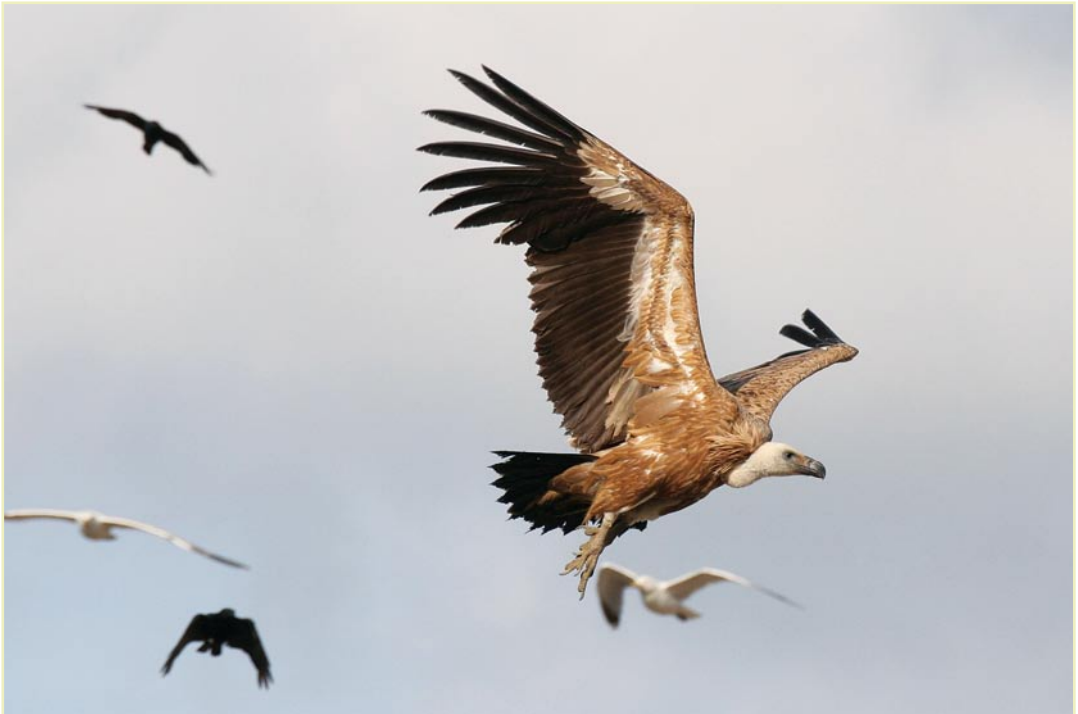
Vautour fauve, Mont-Saint-Guibert, 5 juillet 2007 / Eurasian Griffon, Mont-Saint-Guibert, 5 July 2007

Busard Saint-Martin ( Circus cyaneus ) : nidification réussie dans la plaine d'Outgaarden-Piétrain (3 jeunes à l'envol le 21.07) et dans la région de Givry (au moins 2 jeunes à l'envol). Un couple en parade est également observé début juin à Jandrain. La parade tardive pourrait être le signe d'un échec de la nidification, ce couple ayant été observé précédemment sur le site. Vingt-quatre mentions en août d'oiseaux en dispersion ou déjà en début de migration. Busard cendré ( Circus pygargus ) : cinq nids ont été repérés dans les céréales cet été. Seulement deux (Jandrain et Entre-Sambre-et-Meuse) conduiront 5 jeunes à l'envol au total. Une seconde nichée dans l'ESM, à Clermont, s'est soldée par la mort des 4 poussins probablement liée au passage d'un prédateur. Les œufs n'ont pas éclos à Boneffe et, à Avennes, la nichée (4 poussins) a été volontairement « moissonnée » par l'agriculteur. Busard pâle ( Circus macrourus )* : un mâle de 3 e année les 30 et 31.08 sur la plaine de Clermont-lez-Walcourt. Buse variable ( Buteo buteo ) : quelques observations marquantes en août : 25 ex. aux environs de Verlaine le 20, 15 ex. à Othée le 22, 25 ex. dont 10 en migration avec les bondrées le 25 à Fosses-la-Ville. Cette observation remarquable rappelle que le passage de la Buse variable peut s'amorcer dès la fin de l'été. Balbuzard pêcheur