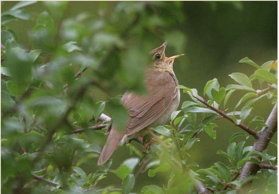
Photo 10 - Locustelle luscinioides . Marche-en-Famenne, 30 juin 2008 / Savi's Warbler. Marche-en-Famenne, 30 June 2008.

Bouscarle de Cetti ( Cettia Cetti ) : bien présente en tous ses sites du Hainaut occidental, en particulier un minimum de 118 cantons à Harchies. Cisticole des joncs ( Cisticola juncidis )* : trois mentions d'un oiseau mais aucune preuve de nidification : le 22.07 à Ochamps, le 23.08 à Éghezée-Longchamps et le 27.08 à Maubray. Locustelle tachetée ( Locustella naevia ) : signalée jusque fin juillet sur des sites de nidification. Quelques densités : 14 cantons à Harchies, 8 chanteurs sur 40 ha à Jamoigne, 12 sur 30 ha à Breuvanne, 6 sur 10 ha à Tintigny. La migration postnuptiale commence le 23.07 à Stockay et se poursuit sur un mode mineur en août. Locustelle fluviatile ( Locustella fluviatilis )* : 1 chanteur du 28 juin au 2 juillet à Marche-en-Famenne. Locustelle luscinioides ( Locustella luscinioides ) : toujours un chanteur en juin à Ploegsteert et Harchies ; un juvénile bagué le 09.07 à Roly, avant les dates habituelles du passage postnuptial, permet de considérer la reproduction comme probable dans la phragmitaie vieillissante locale ; quelques oiseaux bagués à partir du 20 juillet et en août, dont le premier depuis