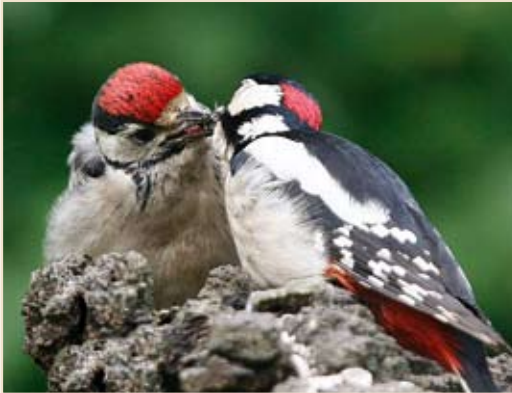
Photo 6 - Pics épeiches juvénile et mâle adulte. Ombret, 14 juin 2008 / Juvenile and adult male Great Spotted Woodpeckers. Ombret, 14 June 2008.

ex. le 21 à Hologne-sur-Geer, le 25 à Saint-Aubin et le 29 à Nassogne. Pic épeichette ( Dendrocopos minor ) : quelques familles signalées, notamment à Pailhe le 23.06, à Mariembourg le 16.06 et à Virelles le 24.06.