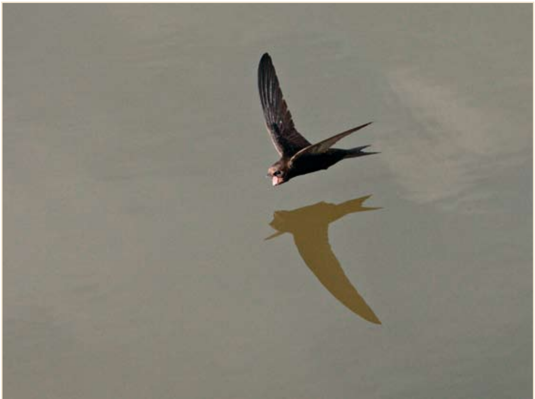
Photo 5 - Martinet noir. Liège, 21 juin 2008 / Common Swift. Liège, 21 June 2008.

Torcol fourmilier ( Jynx torquilla ) : des chanteurs sont encore entendus le 16.06 à Saint-Hubert, le 21.06 à Roûmont (Libin), le 22.06 au Plateau des Tailles et le 25.06 à Malchamps (Spa). En juillet, 1 ex. le 18.07 à Mochamps. À partir de la seconde décade d'août, des données de baguage documentent surtout le discret passage : 8 bagués au total du mois à Nodebais, 11 aux Awirs et 3 bagués le 30 à Pommeroeul. Quelques individus en halte sont aussi mentionnés : 5 ex. du 21 au 31 à Harzé, 1