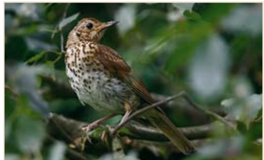
Photo 9 - Grive musicienne juvénile. Ombret, 3 août 2008 / Song Thrush. Ombret, 3 August 2008 (Photo : Jules Fouarge).

Grive litorne ( Turdus pilaris ): l'espèce est au bord de l'extinction à l'ouest de la Meuse : les mentions se limitent à 1 ex. alarmant le 09.06 à Douvrain et 4 cantons probables dans le sud de l'Entre-Sambre-et-Meuse.