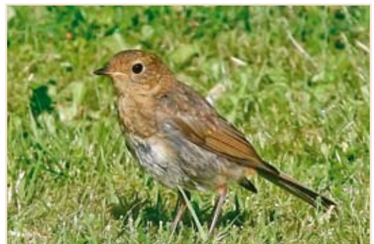
Photo 7 - Rougegorge juvénile. Ombret, 31 juillet 2008 / Juvenile Robin. Ombret, 31 July 2008 (Photo : Jules Fouarge).

Rougegorge ( Erythacus rubecula ) : des mouvements en très petit nombre sont perceptibles dès la mi-août aux stations de baguage de Stockay, des Awirs et de Nodebais. Rossignol philomèle ( Luscinia megarhynchos ) : des migrateurs sont bagués dès le 25.07 à Stockay, le 09.08 aux Awirs et le 16.08 à Nodebais. Gorgebleue à miroir ( Luscinia