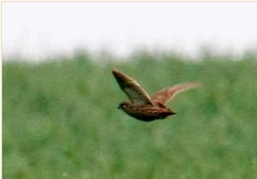
Photo 3 - Caille des blés. Donceel, juin 2008 / Quail. Donceel, June 2008.

km le 21.08 en Hesbaye liégeoise, 67 ex. sur 80 km le 31.08 entre Libramont et Bertrix. Faucon kobez ( Falco vespertinus )* : l'afflux printanier se termine avec un dernier migrateur le 03.06 à Cul-des-Sarts. Faucon émerillon ( Falco columbarius ) : premier migrateur le 23.08 à Ramecroix (Verviers) et quatre autres mentions en août. Faucon hobereau ( Falco subbuteo ) : régulièrement signalé tout le long de l'été dont une concentration de onze le 25.06 à Harchies. Faucon pèlerin ( Falco peregrinus ) : plusieurs données de nidification réussie dont de plus en plus d'occupations de sites naturels.