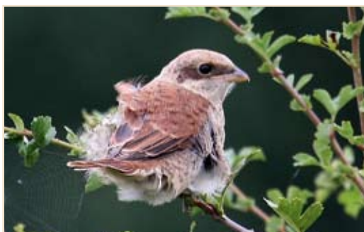
Photo 12 - Pie-grièche écorcheur. Tintigny, août 2008 / Red-backed Shrike. Tintigny, August 2008 (Photo : Charly Farinelle).