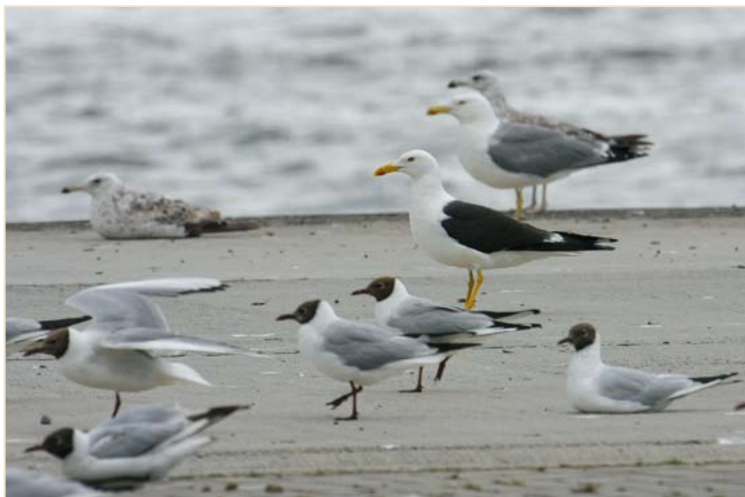
Photo 4 - Possible Goéland de la Baltique, en compagnie de Mouettes rieuses et de Goélants leucophées. Argenteau, 7 juillet 2008 / Possible Baltic Gull, with Black-headed and Yellow-legged Gulls. Argenteau, 7 July 2008.

Mouette mélanocéphale ( Larus melanocephalus ) : en juin, l'espèce est présente à Éghezée-Longchamps (1 ex. de 2 e année le 1 er et 2 deux de 3 e