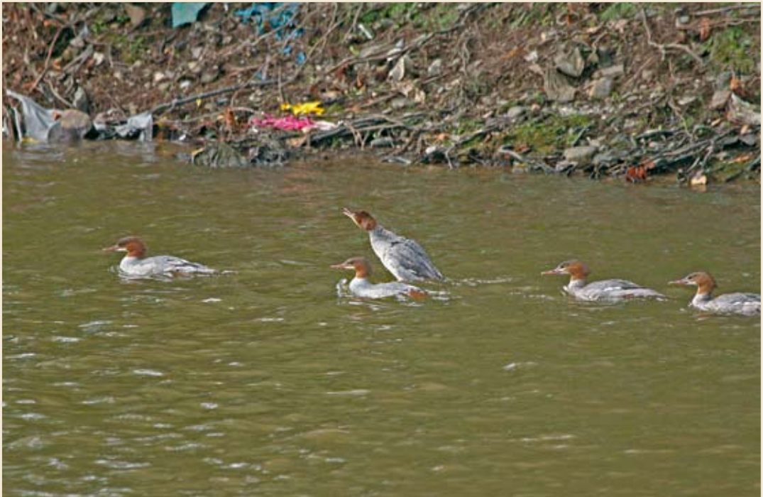
Photo 2 - Harles bièvres. Méry, 7 juillet 2008 / Goosanders. Méry, 7 July 2008.

véniles le 31.08, sur un parcours de 80 km entre Libramont et Bertrix. Vautour fauve ( Gyps fulvus )* : à nouveau quelques mentions en juin : 7 ex. le 07 à Beyne-Heusay, 8 ex. le 21 à Trooz, une quinzaine le 21 à Thuin, une vingtaine le 22 à Dour, 11 ex. le 22 à Havinne, autant le 23 à Boirs et un dernier le 24 à Solwaster. Circaète Jean-le-Blanc ( Circaetus gallicus )* : un immature stationne quelques minutes le 06.07 à Saint-Aubin. Busard des roseaux ( Circus aeruginosus ) : au moins huit couples nicheurs, dont 7 ont conduit des jeunes à l'envol, dénombrés cet été, la plupart dans les marais du Hainaut occidental (4 à Harchies). Une tentative d'installation dans une luzernière a échoué au sud de Tournai ; un succès en culture à Genappe. L'estivage ainsi que celui des autres busards fait l'objet d'un article séparé (pp. 49-56). En août, comme d'habitude, des oiseaux en dispersion ou en migration sont notés un peu partout, entre autres 12 ex. au dortoir le 26.08 à Angre. Busard Saint-Martin ( Circus cyaneus ) : ce busard semble bien devenir un nicheur annuel en wallonie. Nidification réussie (2 jeunes à l'envol) après deux échecs dans la région de Jodoigne ; succès également à Givry (au moins