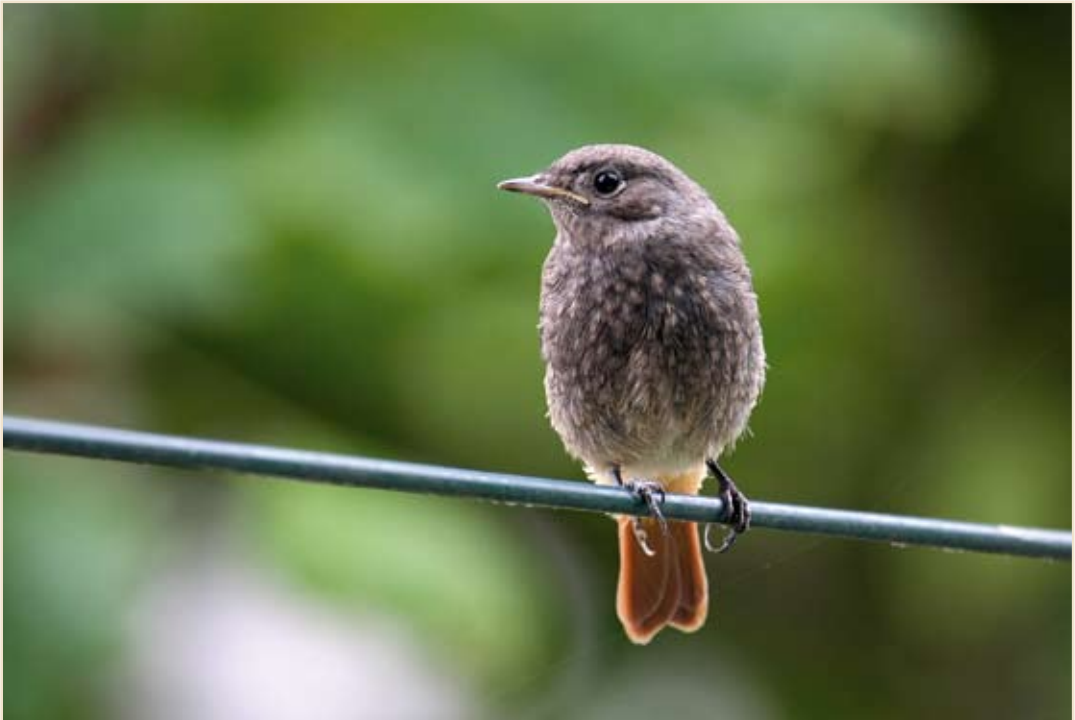
Photo 8 - Rougequeue noir juvénile. Seraing, 6 juin 2008 / Juvenile Black Redstart. Seraing, 6 June 2008 (Photo : Charly Farinelle).

svecica ): l'espèce poursuit son installation dans l'Entre-Sambre-et-Meuse : 2 cantons à Virelles, 2 chanteurs à Morialmé début mai et une nichée à Castillon début juillet. Ailleurs, en dehors du bassin de l'Escaut, l'espèce est présente à Hologne-sur-Geer, à Stockay et Bassilly où 1 jeune volant est observé le 01.07. Tarier des prés ( Saxicola rubetra ): en dehors du dernier bastion dans les cantons de l'Est, quelques couples nichent encore dans le sud de l'Ardenne (Louftémont) et en Lorraine (Turpange et le bassin de la Semois); 1 ex. le 09.06 à Merlemont. Premier migrateur en halte le 29.07 à Harzé, suivi par plus de 250 ex., en majorité durant la seconde quinzaine du mois d'août, en petits groupes comptant maximum 18 ex. Tarier pâtre ( Saxicola torquata ): des jeunes volants sont aperçus principalement entre la mi-juin et la mi-août. 60 cantons sur les communes de Libramont, Bertrix, Libin, Paliseul et Vaux-sur-Sûre ; 5 cantons le 01.07 à Fagnolle... Traquet motteux ( Oenanthe oenanthe ) : 1 mâle le 12.06 à Behême et 1 femelle le 27.06 à Xhendremael. Premier migrateur en halte le 11.08 à Blicquy ; plus de 266 ex. sont ensuite signalés