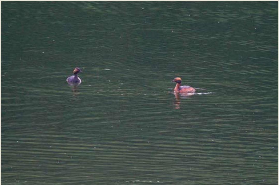
Photo 1 - Grèbe à cou noir et Grèbe esclavon en plumage nuptial. Waremme, 30 juin 2008 / Nuptial Black-necked and Slavonian Grebes. Waremme, 30 June 2008.

( Bubulcus ibis ) : l'espèce s'est reproduite pour la première fois à Hensies. Deux couples, dont un a élevé 3 jeunes, y sont présents tout l'été. Aigrette garzette ( Egretta garzetta ) : nidification et présence en nombre croissant. En passage, Breuvanne le 03.06 et Falemprise le 28.06 accueillent chacun un oiseau, mais c'est Gedinne qui attire l'attention avec 12 ex. le 19.06. Quatorze jeunes provenant de 5 nichées verront le jour à Harchies où un maximum de 42 ex. sont dénombrés mi-juillet. À la même époque, une aigrette est présente le 10.07 à Quévy et 5 ex. le 13.07 à Ploegsteert. Notons encore 3 ex. le 31.07 aux Marionville et fin août à Virelles. Grande Aigrette ( Casmerodius albus ) : l'estivage est de plus en plus régulier. En juin, un individu le 1 er à Waremme, 3 ex. le 10 à Moiricy, 1 ex. le 26 à Philippeville et Viroinval, 1 ex. le 28 à Cerfontaine. En juillet, 2 ex. le 12 à Luchy, 1 ex. le 24 à Roly et 2 ex. le 29 aux Marionville. En août, des isolés à Dénée, Seraing, Hollogne-sur-Geer et Tronquoy. L'espèce est présente tout l'été à Hensies et à Virelles où les dortoirs sont davantage occupés en août avec des pics respectifs de 14 ex. le 01.08 et de 8 ex. à la fin du mois. Héron cendré ( Ardea cinerea ) : la colonie