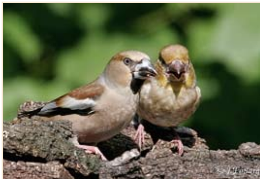
Photo 13 - Grosbec casse-noyaux. Ombret, 10 juillet 2008 / Hawfinch. Ombret, 10 July 2008