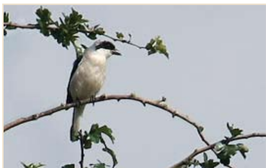
Photo 11 - Pie-grièche à poitrine rose. Oleye, 20 juillet 2008 / Lesser Grey Shrike. Oleye, 20 July 2008.

Pie-grièche écorcheur ( Lanius collurio ) : le record au camp militaire de Marche-en-Famenne est à nouveau battu : 180 cantons. La nidification a réussi à Ghlin. À Somme-Leuze, un couple niche dans la même haie pour la 11 e année consécutive. Tardivement, un couple nourrit encore deux jeunes le 30.08 au Gerny. Pie-grièche à poitrine rose ( Lanius minor )* : un ex. le 20.07 à la limite d'Oleye et Opheers. C'est la 8 e mention en Belgique depuis 1949, la précédente datant de 1988. Pie-grièche grise ( Lanius excubitor ) : cinq cantons dans le camp militaire de Marche-en-Famenne. Des jeunes sortis du nid sont signalés à la mi-juin à Chevroumont, Marche-en-Famenne, Libin et à la mi-juillet à Louftémont où deux cantons sont séparés à peine d'un km. Dès le 01.08, les oiseaux réoccupent les postes de chasse habituels en maintes localités.