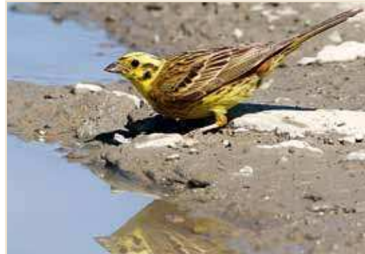
Photo 14 – Bruant jaune. Harzé, 19 juillet 2010 / Yellowhammer. Harzé, 19 July 2010