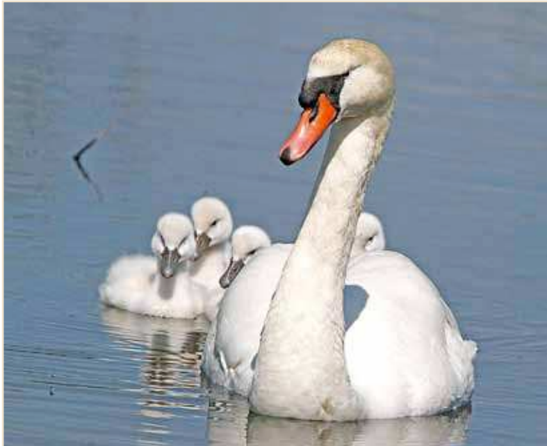
Photo 1 – Cygne tuberculé . Freux, 5 juin 2010 / Mute Swan. Freux, 5 June 2010

24.06 à Thuin. En août, 1 ex. le 04 à Lanaye et le 14 à Chastre. Bernache du Canada Branta canadensis : comme d'habitude, les sites de mue accueillent plusieurs dizaines d'oiseaux en juin, parfois plus de cent : 110 ex. le 15.06 à Freux, 150 ex. le 20.06 à Jambes, 132 le 29 à Vervoz... Des concentrations plus importantes se rencontrent en juillet-août, atteignant 250 ex. le 30.07 à Freux, 250 le 14.08 et 420 le 28.08 à Éghezée-Longchamps. Bernache nonnette Branta leucopsis : une famille avec trois jeunes le 24.07 à Bléharies, première nidification prouvée depuis 2004. Ailleurs, 1-2 ex. pâturant aux abords d'étangs ou de décanteurs wallons. Ouette d'Égypte Alopochen aegyptiaca : les rassemblements estivaux semblent moins importants que l'été précédent avec 65 ex. le 03.08 à Lixhe et 60 ex. le 10.08 à Bierges, alors que les nombres de 2009 avoisinaient le double.