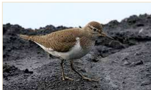
Photo 6 – Chevalier guignette. Seraing, août 2010 / Common Sandpiper. Seraing, August 2010