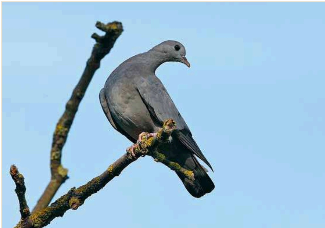
Photo 7 – Pigeon colombin. Visé, 20 juillet 2010 / Stock Dove, 20 July 2010

Chouette de Tengmalm Aegolius funereus : encore 3 données de chanteurs fin juin : 2 en province de Liège, dans la zone de nidification habituelle de l'espèce, et 1 à Willerzie.