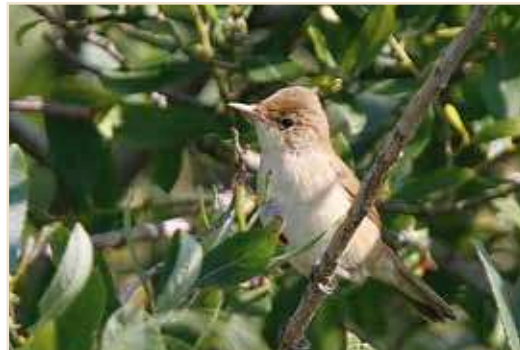
Photo 10 – Rousserolle effarvatte. Hollogne, 12 août 2010 / Eurasian Reed Warbler . Hollogne, 12 August 2010