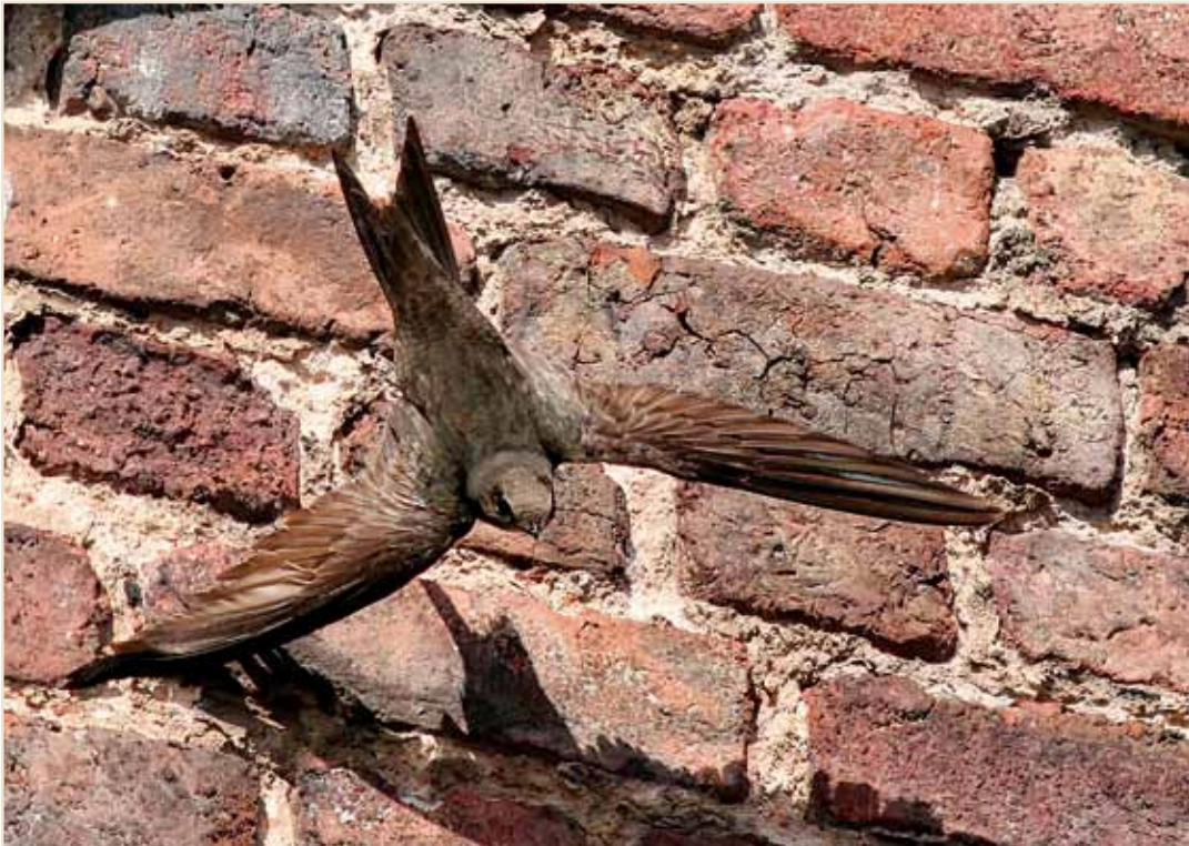
Photo 9 – Martinet noir. Remouchamps, 10 juillet 2010 / Common Swift. Remouchamps, 10 July 2010

partir de la mi-août (maxima de 183 ex. à Ramecroix le 25.08 et 186 ex. le 31.08 à Benonchamps). Les regroupements s'étoffent au cours de la dernière décade du mois : 150 ex. le 23 à Gouvy, 250 ex. le 25 à Tintigny, 400 ex. à Harchies et 220 ex. à Stockay le 29, 250 ex. à Somzée le 31. Hironnelle de fenêtre Delichon urbicum : la construction et la restauration de nids se poursuivent en juin ; des nichées sont encore observées fin août. Des nombreuses données sur la nidification, retenons 102 nids entiers dont 60 occupés à Amay et 50-60 couples à Bruxelles-Haren, les autres colonies ne dépassant pas les 40 nids. Plus négativement, la diminution continue à Obourg où il ne reste que 29 nids. Des rassemblements assez importants débutent fin juillet (100 ex. le 26 à Saint-Aubin et 80 ex. le 27 à Folx-les-Caves). Les premiers migrants sont vus le 31.07 à Flémalle et la taille des bandes augmente début août pour atteindre à la fin du mois 250 ex. le 25 à Bertrix, 200 ex. le 28 à Hollogne-sur-Geer, 300 ex. le 29 à Harchies et La Hulpe.