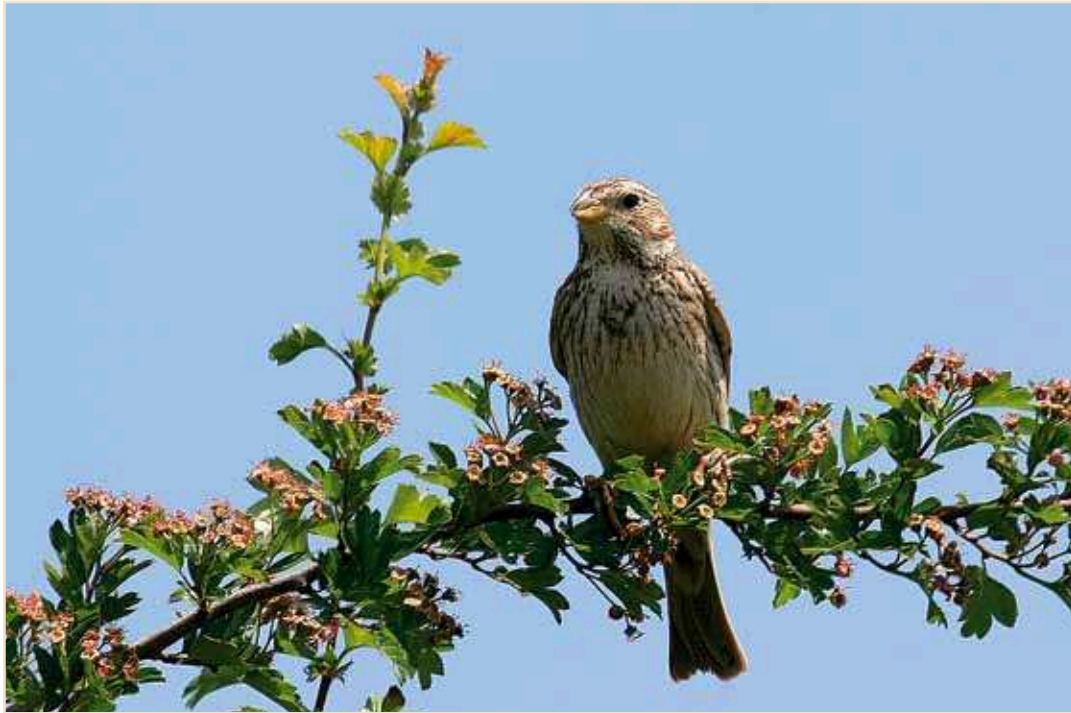
Photo 13 – Bruant proyer. Horion, juillet 2010 / Corn Bunting. Horion, July 2010

en juillet dans le sud de la Wallonie et l'absence de données au nord du sillon Sambre-et-Meuse confirment le déclin régional. Verdier d'Europe Carduelis chloris : en août, peu de groupes et leur taille ne dépasse pas la cinquantaine. Char-donneret élégant Carduelis carduelis : les données proviennent de l'ensemble de la Wallonie et de Bruxelles, à l'exception de l'est de la Hesbaye et du Pays de Herve, ce qui confirme les lacunes repérées au cours de l'Atlas. Un rassemblement vespéral de 27 ex. dans un bouleau le 29.06 à Frasnes-lez-Buissenal pourrait être un dortoir. Le 29.07, une cinquantaine d'individus fréquentent un « champ » de chardons à Anderlecht. Tarin des aulnes Carduelis spinus : en juin et juillet, de petits groupes sont mentionnés en divers sites de Haute-Belgique ; au plus, 10 ex. le 27.06 dans la vallée de la Hozwarche et 20 ex. le 09.07 à Willerzie. Hors zone de nidification potentielle, une bande de 12 ex. est observée le 12.07 à Couthuin. En août, ces bandes s'étoffent quelque peu : 11 ex. le 03 à Samrée, 16 le 07 à Harzé, 32 le 14 à Willerzie et 13 en vol vers le sud-ouest le 28 à Ramecroix. Linotte mélodieuse Carduelis can-