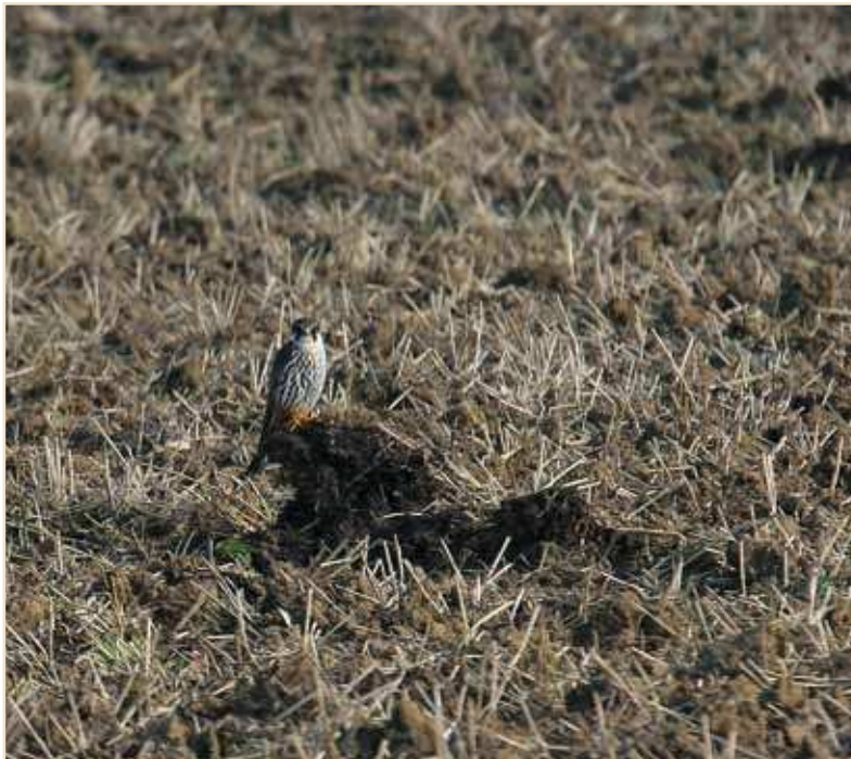
Photo 5 – Faucon hobereau. Horion, août 2010 / Eurasian Hobby, August 2010

Petit Gravelot Charadrius dubius : nidification prouvée en juin-début juillet à Gaurain-Ramecroix, Harmignies, Lives-sur-Meuse, Hermalle-sous-Huy, Flémalle-Haute et Mornimont. Le passage postnuptial débute à la mi-juillet par petits groupes dépassant rarement les 5 exemplaires. Au plus 12 ex. le 22.07 à Éghezée-Longchamps. Grand Gravelot Charadrius hiaticula : après un migrateur pré-nuptial tardif le 05.06 à Hollogne-sur-Geer et 2 ex. en passage postnuptial précoce le 12.07 à Virelles, l'espèce est notée sur 10 sites en août avec pour la plupart 1-2 ex. hormis 4 le 20 à Boneffe et 8 le 27 à Seraing-le-Château. Pluvier guignard Charadrius morinellus : le passage débute le 17.08 par la présence de 49 ex. sur 6 sites dont 20 au plateau du Gerny. Signalé ensuite sur 20 sites jusqu'au 31. Des suivis réguliers sur trois plaines donnent 11 ex. le 18, 21 le