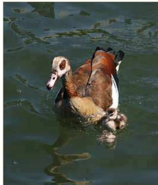
Photo 2 – Ochette d'Égypte . Liège, juin 2010 / Egyptian Goose. Liège, June 2010

Tadorne de Belon Tadorna tadorna : en plus des couvées écloses en mai, on signale 1 nichée à Froyennes, 2 aux Marionville, à Héringnes et à Holognes-sur-Geer ainsi que 3 nichées supplémentaires aux décanteurs de Warcoing, ce qui porte à 5 le nombre total pour ce dernier site. Canard mandarin Aix galericulata : mentionné dans dix localités au cours de l'été mais une seule nidification est ren-