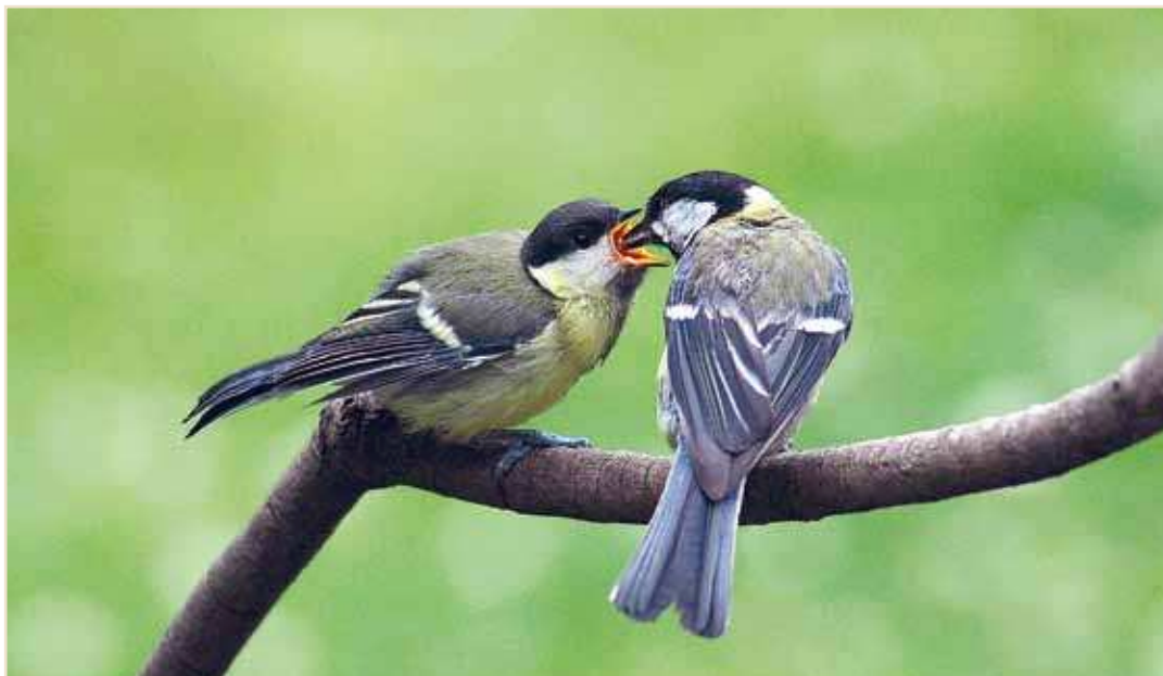
Photo 12 – Mésange charbonnière. Profondeville, 5 juillet 2010 / Great Tit. Profondeville, 5 July 2010

Pinson des arbres Fringilla coelebs : un seul rassemblement important en fin d'été : plus d'une centaine le 17.08 à Harzé. Pinson du Nord Fringilla montifringilla : totalement hors saison, 1 ex. le 01.06 à Gaurain-Ramecroix. Serin cini Serinus serinus : la rareté des chanteurs en juin et