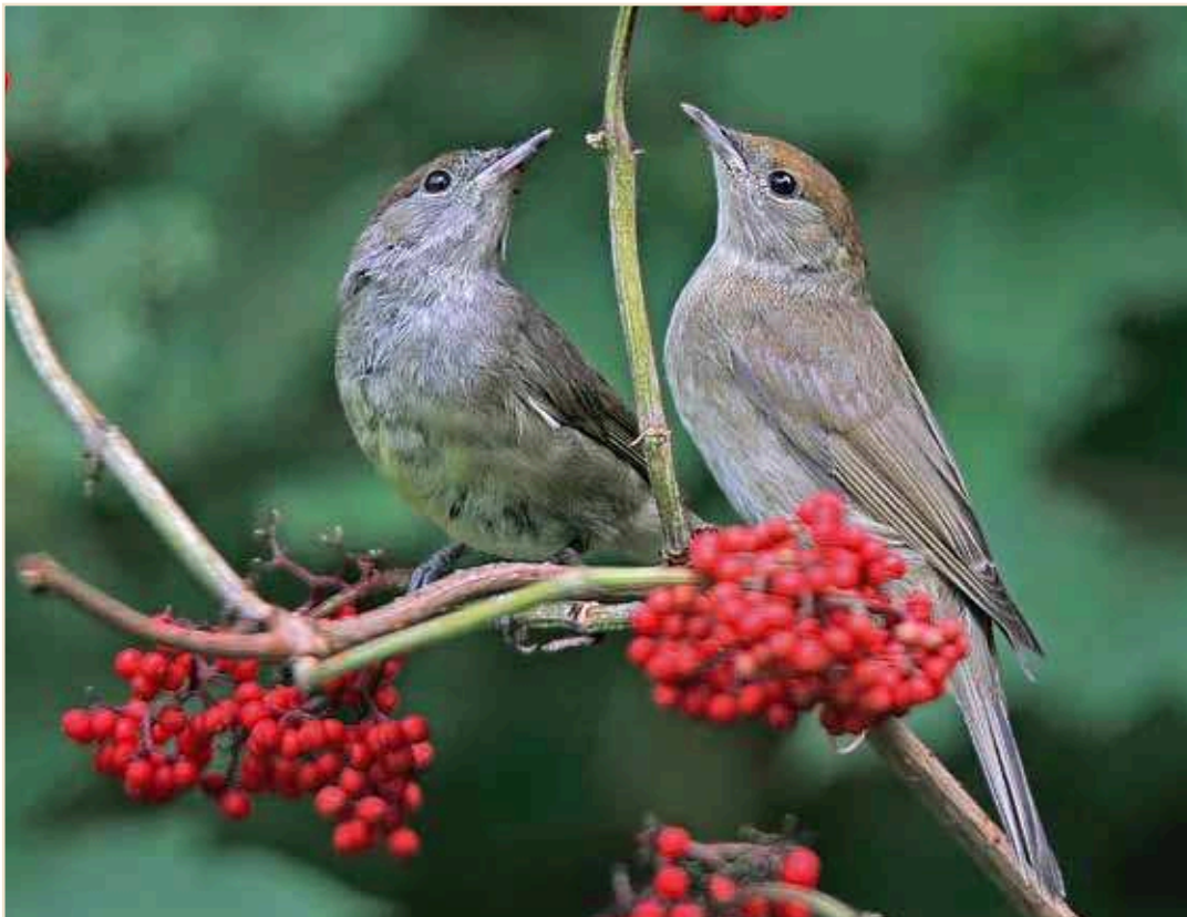
Photo 11 – Fauvette à tête noire. Ombret, 10 juillet 2010 / Eurasian Blackcap. Ombret, 10 July 2010

migrant surtout en août. Au total, tant à Stockay qu'aux Awirs, les captures sont moins nombreuses qu'en 2009, la différence se marquant uniquement au niveau des jeunes, ce qui tend à démontrer une moins bonne réussite des nidifications en 2010. Rousserolle turdoïde Acrocephalus arundinaceus : les chanteurs de mai ne sont plus entendus que sur 2 sites. Plus aucune mention n'est effectuée à Latour après le 01.06 tandis qu'un couple reste aux Marionville. Le mâle y chante jusqu'au 23.06 mais aucune preuve de nidification n'est apportée. L'espèce est rare au passage postnuptial : une seule capture le 31.07 à Harchies. Hypolaïs ictérine Hippolais icterina : si des nicheurs potentiels sont signalés jusqu'au 18.07 en région limoneuse et au Pays de Herve, on retiendra surtout un chanteur le 30.06 à Saint-Aubin où un couple s'était cantonné en 2009. Une autre mention provient de l'ESM : 1 chanteur les 24-25.06 à Olloy-sur-Viroin. La migration postnuptiale débute le 20.07 aux Awirs où 13