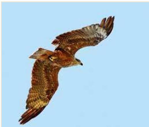
Photo 4 – Milan noir. France, 21 juillet 2010 / Black Kite, 21 July 2010

16 sites en juin dont 2 estivants à Sainte-Marie-sur-Semois. Quelques mentions en juillet (notamment 6 ex. en vol le 04 à Liège), se multipliant en fin de mois (e.a. un vol de 12 ex. le 25.07 à Thulin). Le passage s'amplifie à la mi-août : 30 ex. le 14 à Rhisnes et le 15 à Pesche, 20 ex. le 17 à Beuzet, 23 ex. le 28 à Courrière et 62 ex. le 31 à Corroy-le-Grand où les oiseaux passent la nuit sur les lampadaires de l'autoroute E411 Namur-Bruxelles.