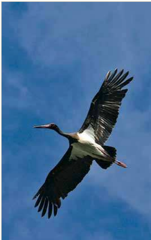
Photo 3 – Cigogne noire. Nassogne, juillet 2010 / Black Stork

pectifs de 31, 27, 25 (9 nichées) et 38 ex. Virelles et Harchies abritent quant à eux des minima de 37 et 75 ex. Grèbe huppé Podiceps cristatus : renseigné nicheur sur à peine une vingtaine de plans d'eau, toujours en petits nombres hormis Harchies qui en compte minimum 20 le 03.06. Ce site accueille au plus 113 ex. (adultes et pulli) le 11.07. Citons encore 38 ex. le 28.06 aux carrières d'Obourg et 65 ex. le 29.08 à Roly. Grèbe à cou noir Podiceps nigricollis : une première reproduction (2 couples) cet été à Virelles. Ce grèbe est aussi signalé nicheur sur les sites classiques de Ploegsteert, Harchies, Frasnes-lez-Anvaing, Genappe et Hologne-sur-Geer. Des parades ont eu lieu à Éghezée-Longchamps mais la nidification n'a pas été constatée. Des oiseaux de passage sont aussi mentionnés aux Marionville, à Brugelette, Gozée et Amay. Au vu des données, il est difficile de se faire une idée du nombre exact de couples nicheurs sur les différents sites.