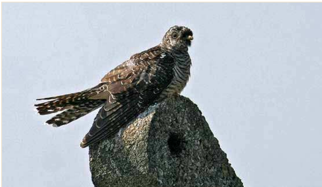
Photo 8 – Cocou gris. Velroux, août 2010 / Common Cuckoo. Velroux, August 2010

Hirondelle de rivage Riparia riparia : mentionnée sur au moins 45 sites en juin-juillet. Hors Lorraine où nichent plus d'un millier de couples, les colonies les plus importantes se situent à Harmignies (125 terriers), Mont-Saint-Guibert et Chaumont-Gistoux (maximum 90 terriers chacune). Un maximum de 130 ex. est observé aux Marionville mais la colonie n'a pas été repérée. La migration débute discrètement le 14.08 avec 2 ex. en vol vers le sud-ouest à Nismes. Mention du passage est aussi faite à Ramecroix (1 ex. le 20.08) et Benonchamps (4 ex. le 22.08, 1 le 31). Hirondelle rustique Hirundo rustica : suite probable des conditions difficiles de mai, des couples s'installent encore début juin. Une même étable à La Reid voit la réussite de 46 nichées rien qu'au cours du mois de juin. De petits rassemblements sur les fils électriques sont observés à partir du 21.07 et, le 30.07, une concentration de 400 ex. est signalée à l'étang de Virelles. Dès début août, les rassemblements deviennent plus nombreux mais leur taille reste inférieure à 100 ex. au cours des trois premières semaines du mois. La migration commence timidement le 02.08 avec 5 ex. à Thommen mais elle ne s'intensifie qu'à