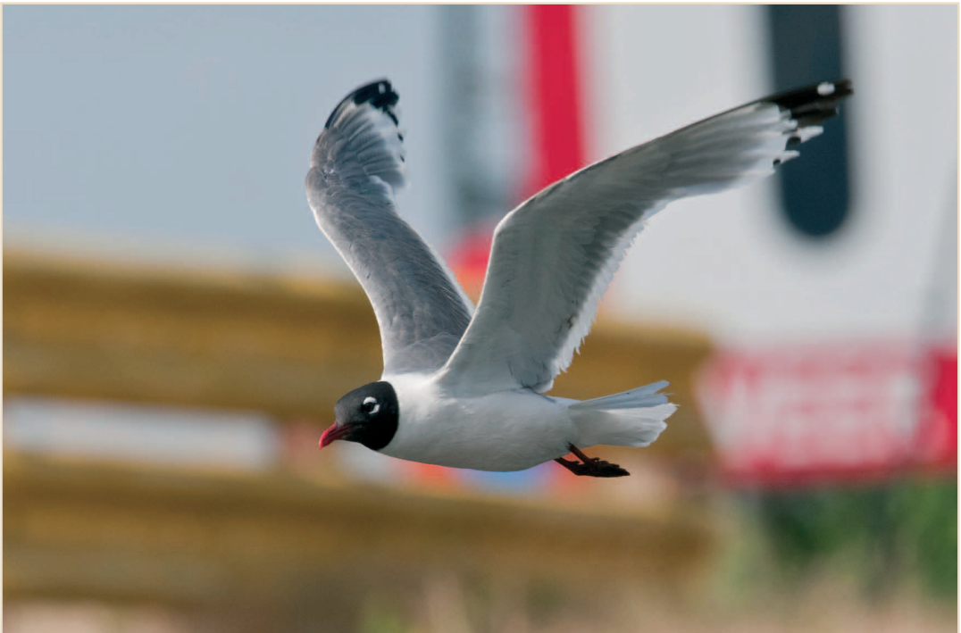
Photo 2 – Mouette de Franklin / Franklin's Gull Larus pipixcan (Gent [O], 12-07-2009,)