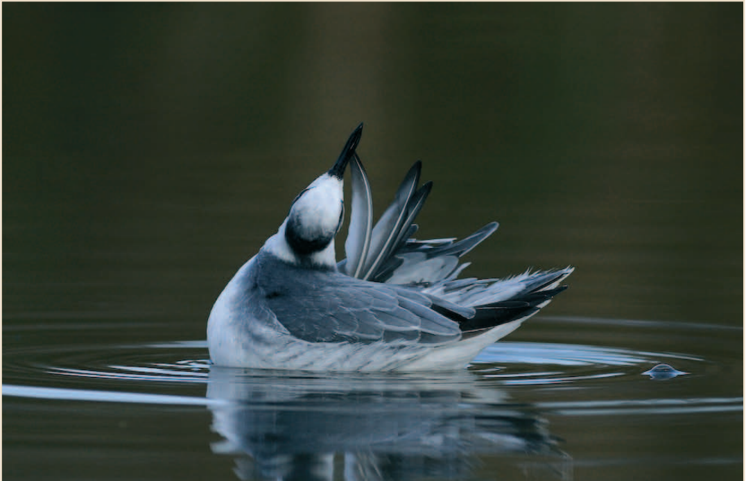
Photo 7 – Phalarope à bec large / Grey Phalarope Phalaropus fulicarius (Hollogne-sur-Geer, 30-11-2009,)

– 30 janvier 2009, Saint-Ghislain (H), Tertre : 1 imm. de 2 e hiver (basé sur www.observations.be ; photos).