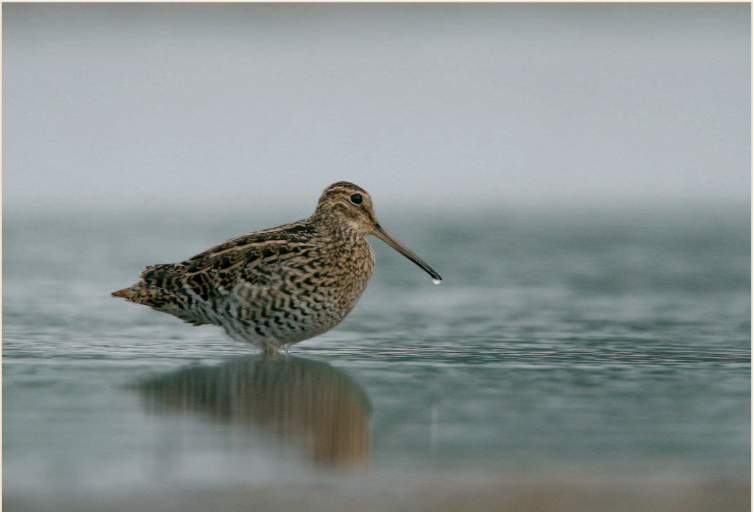
Photo 1 – Bécassine double / Great Snipe Gallinago media (Rotem [L], 06-05-2007,)