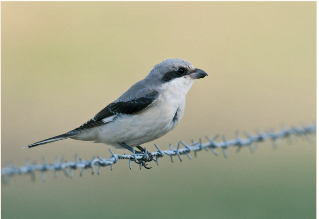
Photo 5 – Pie-grièche à poitrine rose / Lesser Grey Shrike Lanius minor (Othée [L] 29-08-2009,)

– 11 octobre 2008, Oorderen (A), De Kuifeend : 1 imm. de 1 er hiver, ssp. L. i. phoenicuroides (basé sur www.observations.be ; BAHC).