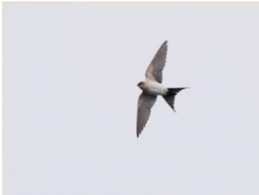
Photo 3 – Hirondelle rousseline / Red-rumped Swallow Cecropis daurica (Knokke [W], 17-11-2009,)