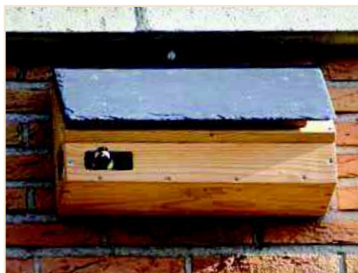
Photo 18 – En l'absence de corniche, une double toiture inclinée à 45° protégera les occupants des prédateurs au nid et d'un trop fort ensoleillement, tout en améliorant la longévité de vos nichoirs (protection contre la pluie). En plaçant des nichoirs à Martinets, vous aiderez aussi plusieurs autres espèces citadines, dont le Moineau domestique ou, comme ici, la Mésange charbonnière (notons que ces espèces sédentaires s'abritent parfois ponctuellement dans des nichoirs de Martinets, pendant l'hiver) / Where there is no cornice a sloping double roof at 45° will protect the occupants of the nest box from predators and over-strong sunlight, while also lengthening the life of your nest box (protection against rain). In installing nest boxes for the Common Swift you will also help various other town birds, such as the House Sparrow, or as here the Great Tit (note that these resident species sometimes use Swift nest boxes during the winter)