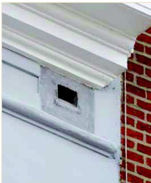
Photo 11 – Aménagement de trou de boulin « à l'italienne » / An Italian style scaffolding hole