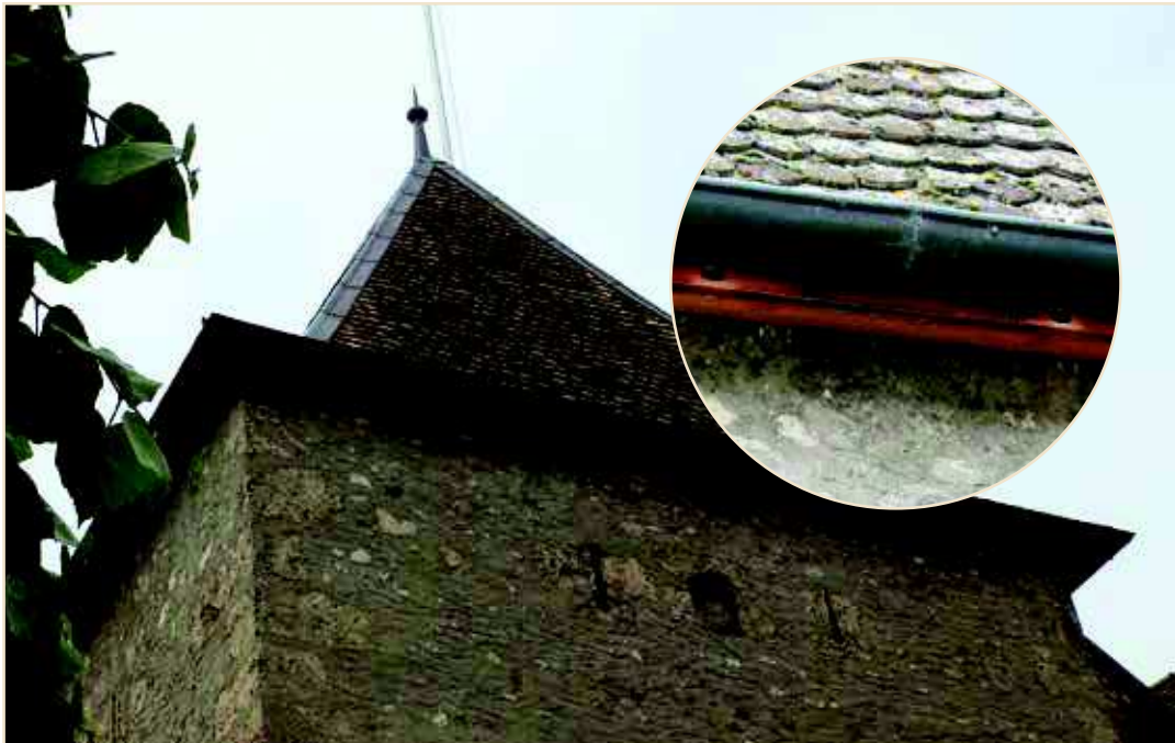
Photo 9 – Gros plan sur une discrète « fausse corniche pour Martinets » au Château de Rolle / View from above of a discrete «false cornice» provided for Common Swifts at the Château de Rolle