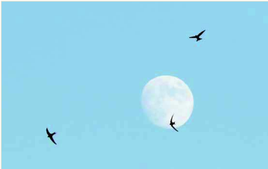
Photo 1 – Avec son corps fuselé, le Martinet noir est parfaitement adapté à une vie presque exclusivement aérienne / With its streamlined body the Common Swift is perfectly adapted to a life spent almost entirely on the wing

Largement répartie sur pratiquement toute l'Eurasie durant la courte période de nidification, cette espèce vit 9 mois par an en Afrique subsaharienne, entre le bassin du Congo et l'Afrique du Sud (CHANTLER et al. , 2018). Chaque année, les individus migrent jusqu'à 10.000 km pour se reproduire. La maturité sexuelle est atteinte dans le cours de la 3 e voire 4 e année de vie ; les immatures réalisent également ce long périple mais ne séjournent que deux petits mois, voire un seul lors de leur premier voyage, au cours de leur 2 e année calendaire (GENTON & JACQUAT, 2014). Les oiseaux mettent à profit cette courte période pour déjà rechercher un site de nidification approprié, durant les « rondes sonores » qu'ils accomplissent, avec leurs congénères, autour du périmètre qu'ils ont choisi (LACK, 1956 ; GENTON & JACQUAT, 2014).