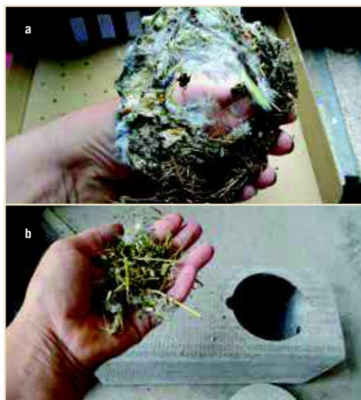
Photos 19a et b – Au-dessus, un nid typique de Martinet. En plaçant une petite poignée de matériaux (photo b), vous pouvez accélérer l'adoption de vos niochirs / On the above picture, a typical nest of the Common Swift. By placing a small handful of nesting material (Photo b) you can speed the adoption of your nest boxes

Votre niochir est enfin occupé ? Bravo ! Vous voulez pouvoir suivre la « vie de famille » en direct ? L'installation d'une webcam ne doit pas se faire sans précautions : ne la fixez pas avec des adhésifs doubles-faces : ils se décolleront après quelque temps, risquant d'abîmer les plumes vitales de cet oiseau. En outre, comme les Martinets semblent rechercher des recoins obscurs pour construire leur nid, les lampes à infrarouges sont recommandées.