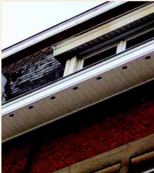
Photo 7 – Nouvelle corniche qu'un particulier a aménagée pour les Martinets / A new cornice that a householder has provided for Common Swifts