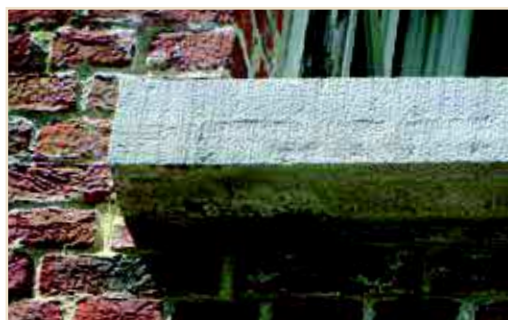
Photo 15 – Des martinets nichaient sous plusieurs tablettes de fenêtre de ce bâtiment universitaire. Lors du ravalement des façades, la KU Leuven, propriétaire, a accepté une « rénovation douce » : laisser deux orifices accessibles sous chaque appui de fenêtre suffisamment élevé. Les Martinets ont adopté ces espaces au point de développer la colonie locale ! Common Swifts were nesting under various window sills of this university building. During the upgrading of the building facades, the proprietor, KU Leuven, agreed to a "soft refurbishment", leaving two access holes under each of the upper window sills. The Common Swifts adopted these spaces and as a consequence the local colony increased

Du côté du GTM, le nouveau propriétaire d'une ancienne bâtisse située à Hulsonniaux, rénovée juste avant la vente, a décidé de rétablir 6 trous colmatés où il avait pu observer des martinets entrer et sortir. Après concertation avec le GTM, il a retiré la nouvelle maçonnerie au burin puis réalisé un orifice esthétique (Photos 16a et b) s'inspirant du moule conçu par l'association britannique Action for Swifts 4 .