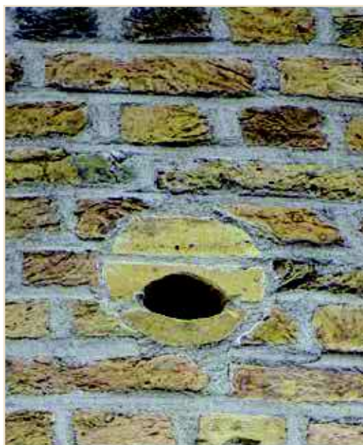
Photo 12 – Aménagement discret d'un trou de boulin au moulin de Standdaarbuiten (Pays-Bas) / A discrete scaffolding hole installed at the Standdaarbuiten mill (Netherlands)