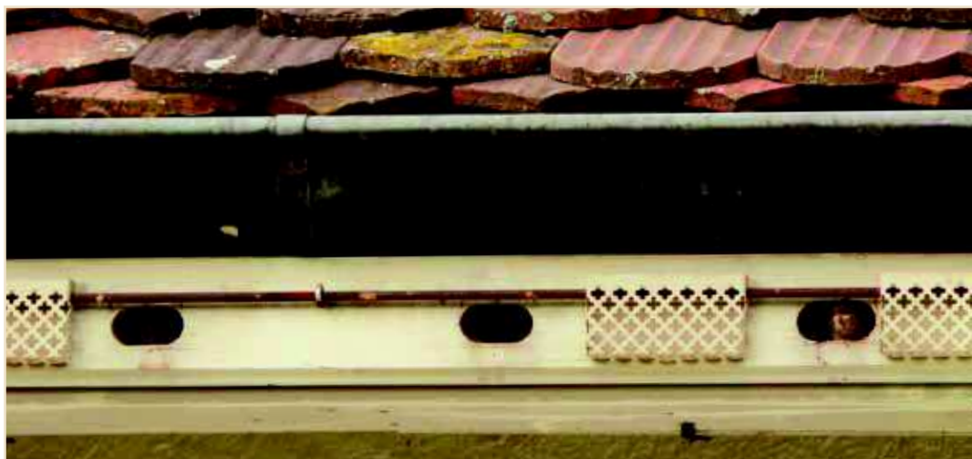
Photo 2 – Jeune Martinet (à gauche) et jeune Moineau (à droite) : ces espèces peuvent cohabiter pacifiquement si le nombre de cavités disponibles est suffisant / Young Common Swift (left) and young House Sparrow (right): if there are enough suitable cavities these species can coexist peacefully