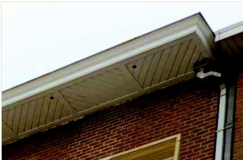
Photo 8 – Trous réalisés dans la corniche d'un bâtiment, lors d'une réfection de toiture / Holes made for Swifts in the cornice of a building during roof repairs

nouvelles ou anciennes corniches. Selon les cas, elles offrent de 1 à 13 logettes. Au total, cela représente 96 cavités.