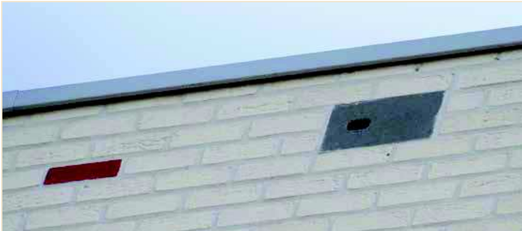
Photo 14 – Dans ce bâtiment passif bruxellois, plusieurs briques-nichoirs ont été intégrées à la façade, parmi les briques colorées décoratives. Cet aménagement discret et esthétique a fait ses preuves aux quatre coins d'Europe : les Martinets, mais aussi les Moineaux, les trouvent généralement plus vite que de simples nichoirs extérieurs, car ils s'apparentent aux trous de ventilation que ces oiseaux connaissent bien / In this Brussels "passive" building, several nesting-bricks were incorporated among the decorative coloured bricks in the facade. This discreet and aesthetically pleasing improvement has proven its worth in buildings across Europe: Common Swift and House Sparrows generally find these bricks more quickly than simple external nest boxes, because they resemble the ventilation holes with which these birds are already familiar

D'autres nichoirs intégrés (15 pour Martinets, répartis entre 5 bâtiments) sont en cours d'installation à Laeken, dans le futur écoquartier Tivoli. Dans les nouveaux projets qu'accompagne le GTM, les architectes décident de plus en plus de concevoir des aménagements « mixtes » pour la biodiversité, où ils prévoient des nichoirs intégrés non seulement pour les Martinets, mais aussi pour les Moineaux et pour les chauves-souris.