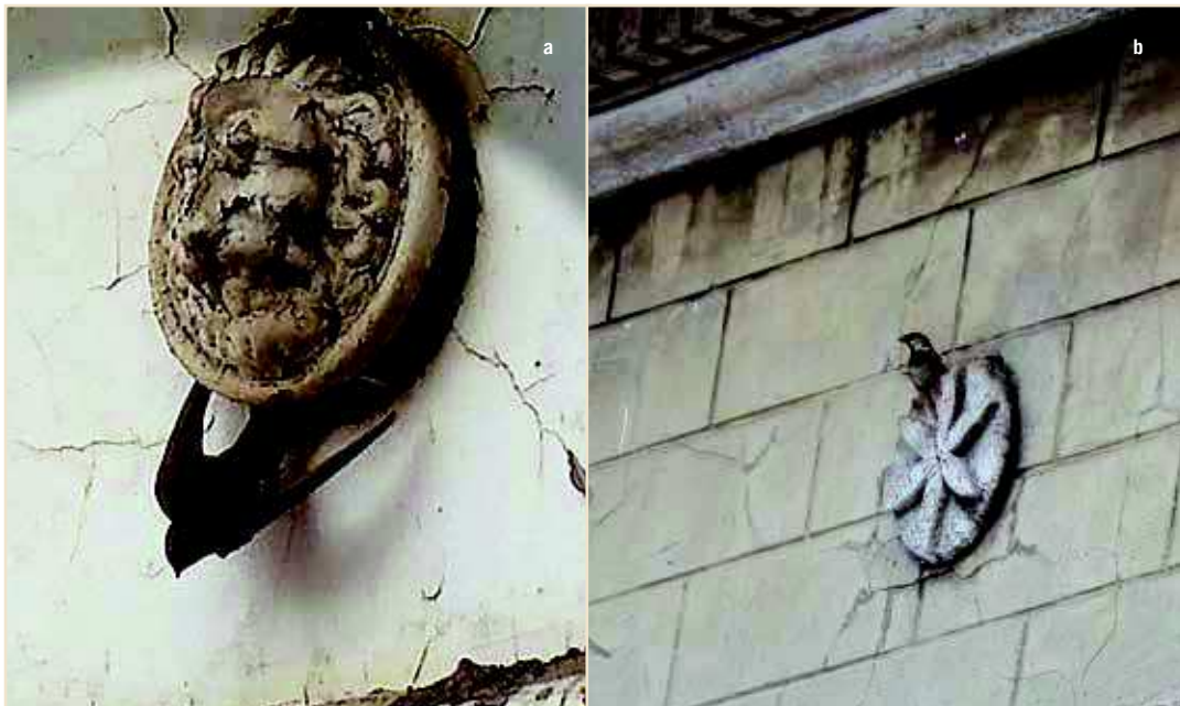
Photos 10a et b – Les trous de boulin entrouverts permettent la nidification du Martinet, mais également du Moineau domestique / When ajar, scaffolding holes offer suitable cavities for Common Swift and House Sparrow