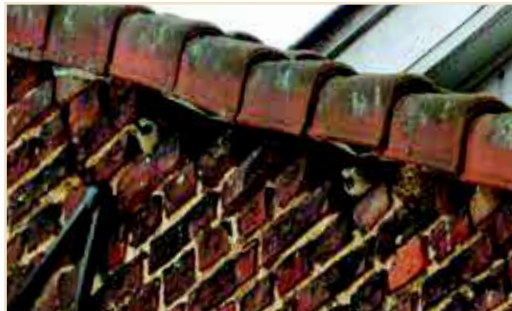
Photo 4 – Les espaces sous les tuiles de rive, populaires tant chez les Martinets que chez plusieurs autres espèces, comme ici les Moineaux / The spaces under the verge tiles are favoured both by the Common Swift and by several other species; in this case the House Sparrow