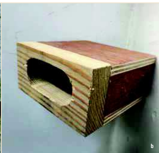
Photos 16a et b – Après avoir appris que la rénovation de cet ancien presbytère avait supprimé des cavités de Martinets, le nouveau propriétaire a décidé de rétablir les trous colmatés. Conseillé par le GTM, il a retiré la nouvelle maçonnerie au burin puis réalisé un orifice esthétique et discret ! Learning that the renovation of this former rectory had suppressed cavities used by Common Swift, the new owner decided to restore the holes which had been blocked. Following the advice of the Swifts Working Group, he removed the new masonry by chisel, replacing it by discrete and aesthetically pleasing entry holes