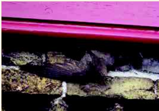
Photo 3 – Si les cavités disponibles sont insuffisantes, les oiseaux se disputent les sites de reproduction / If there are not enough cavities available, then the birds compete for the same breeding place